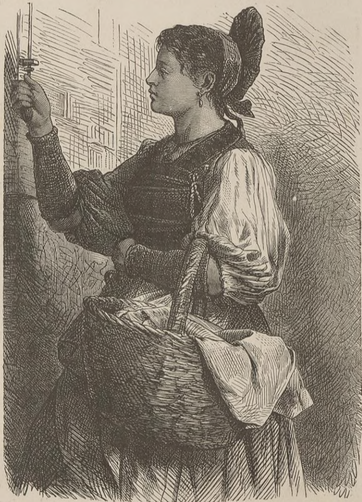
COSTUME DU CANTON DE SCHAFFHOUSE.

L'année s'écoula sans qu'on entendît parler de rien. En conséquence, on se disposait à liquider le gage, quand défense arriva, de par Sa Majesté, « toujours auguste », de vendre aucun des objets