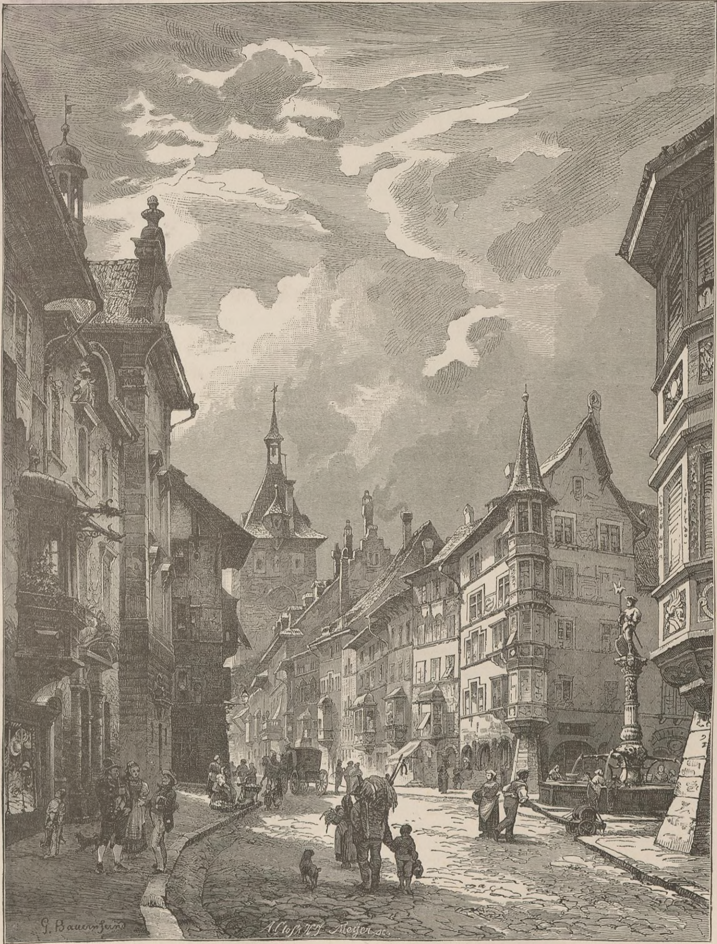
UNE RUE A SCHAFFHOUSE.