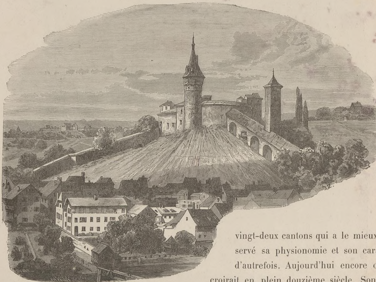
CHATEAU MUNOTH (SCHAFFHOUSE).

Située dans la vallée de la Durach, la vieille Schaffhouse aux murs gris est peut-être la ville des