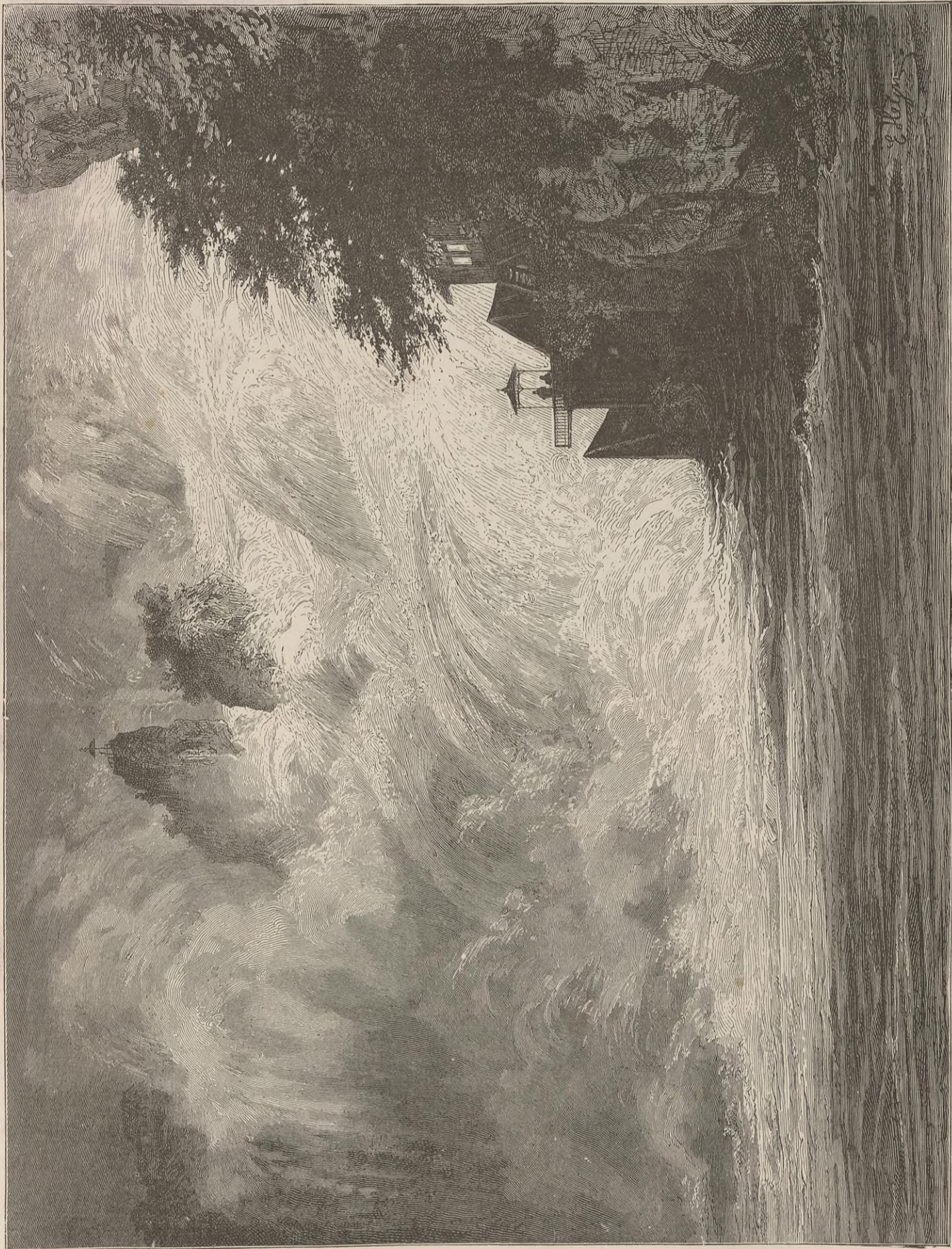
CHUTE DU RHIN PRÈS DE SCHAFFHOUSE.