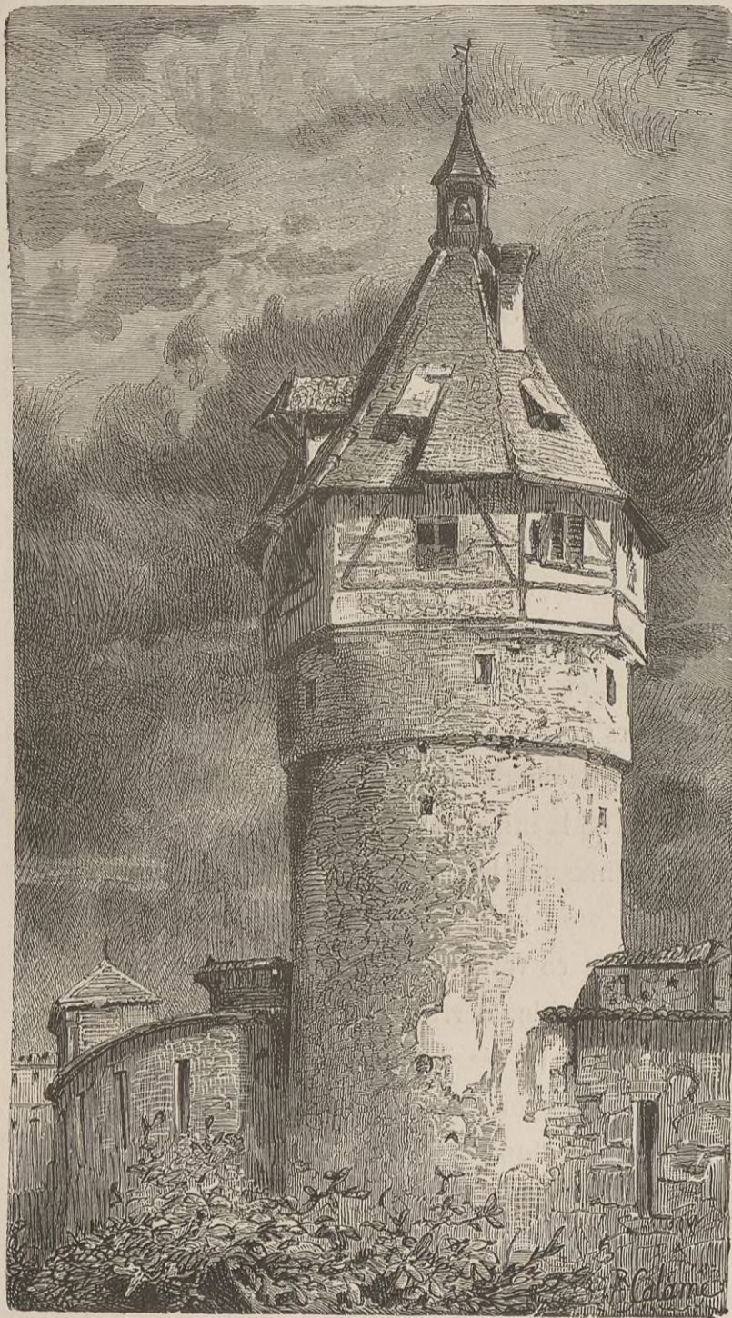
UNE TOUR A SCHAFFHOUSE.

curiosité historique, le fameux Entrepôt (1), vieux de cinq cents ans, où se sont accomplis tant de faits édifiants. La salle du concile, nouvellement restaurée, et décorée d'une quinzaine de fresques relatives à l'histoire de la ville, est au premier étage de l'édifice. Elle a 48 mètres de long sur 32 de large, et est soutenue par de gros piliers de chêne. Là on vous montrera deux fauteuils minables, décorés du titre de trônes, qui eurent, dit-on, l'honneur de servir de sièges à l'empereur Sigismond et au pape de Rome. En face, sur une estrade, on vous fera voir par surcroît des figures de cire qui sont censées représenter Jean Huss, Jérôme de Prague, et le dominicain Carceri, — un vrai nom d'emploi, — leur accusateur.