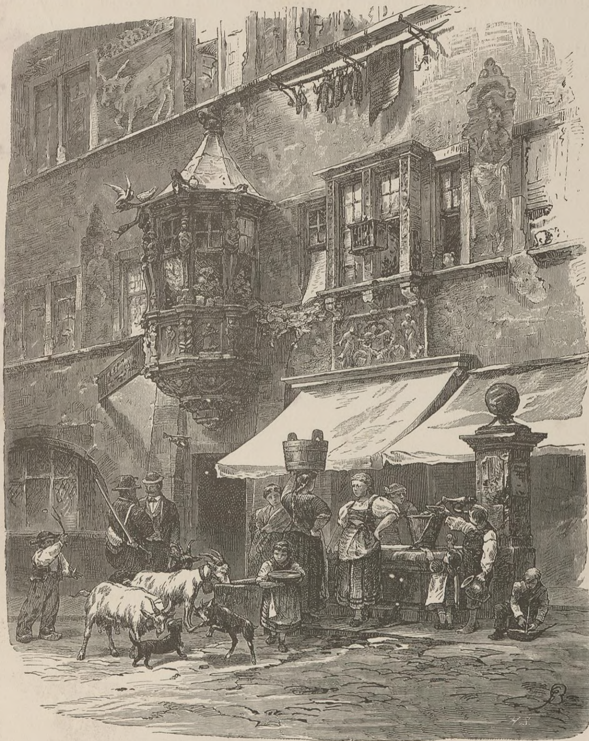
UNE MAISON A SCHAFFHOUSE.

Le canton de Schaffhouse, le seul de la Suisse qui soit sur la rive droite du Rhin, c'est-à-dire en dehors des limites naturelles du pays, est d'une fertilité admirable. Vu du beau signal de la Hohe-Fluh qui domine le chef-lieu, il n'offre de toutes parts que hauteurs boisées, riches cultures, vallons verdoyants