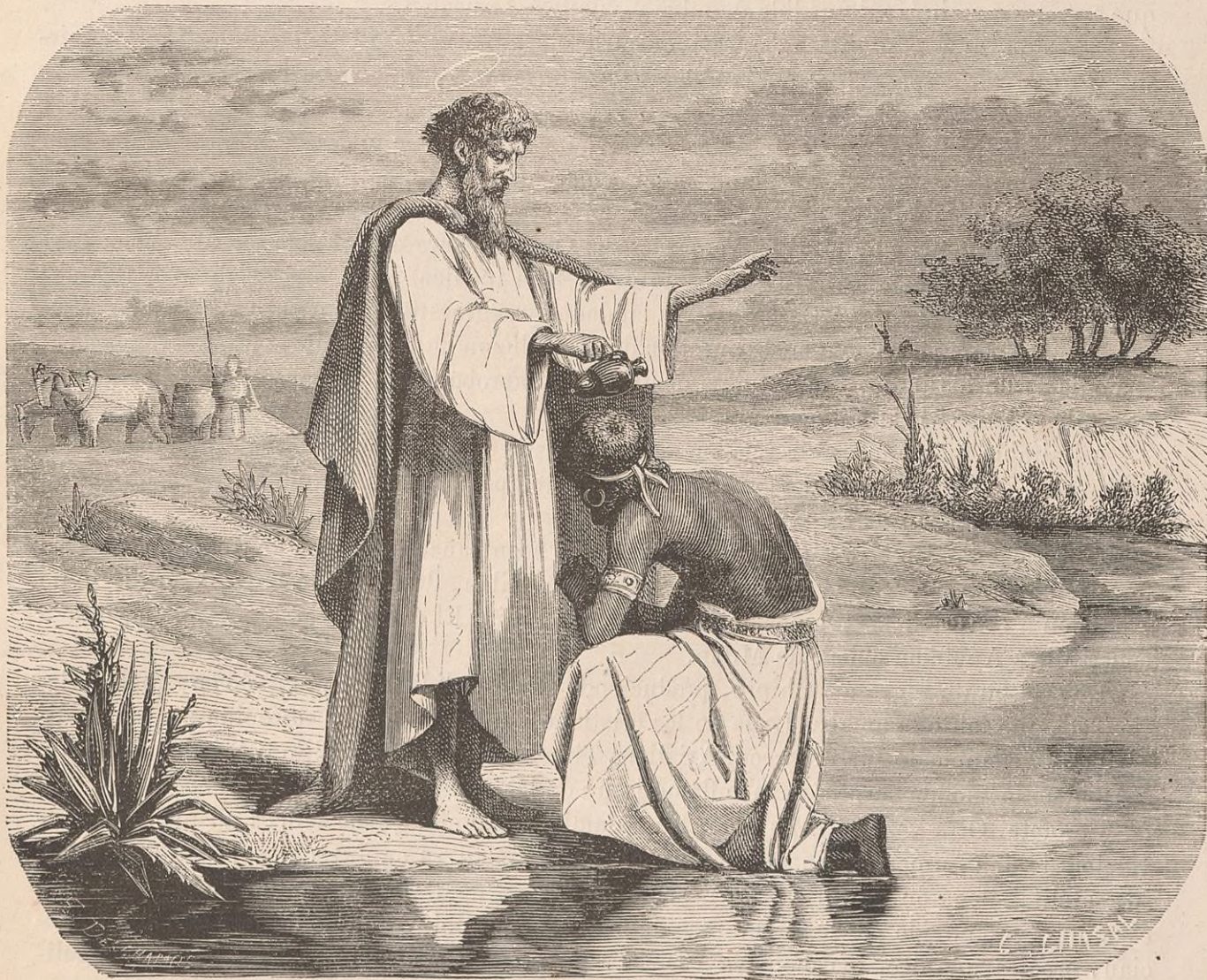
BAUTIZO DEL EUNUCO.

Era sin duda aquel uno de los mas ilustrados discipulos del Señor. Lleno de caridad sostuvo con Pablo, ya convertido, la necesidad de admitir á todos los gentiles en el seno de la nueva Iglesia. Abrió las puertas del templo moral á cuantos apetecian entrar en el reino de Dios.