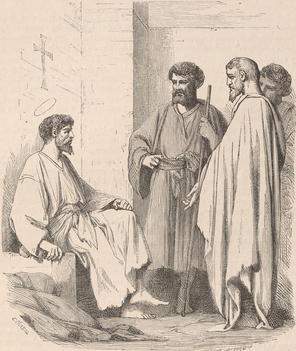
ESTÉBAN Y SUS ADVERSARIOS.

La historia y la teología ofrecieron al sábio apologista datos preciosos, argumentos contundentes que usó con especial inspiracion. Confusos los senadores, sentian germinar una simpatía pura, pero involuntaria á favor del Santo que les hablaba ingénuo lenguaje. La energía de Estéban subia de matiz ante la vacilacion notable de sus jueces. Hombres de dura cerviz , les dijo, y de corazon y vida incircuncisos , vosotros resistís siempre al Espiritu San-