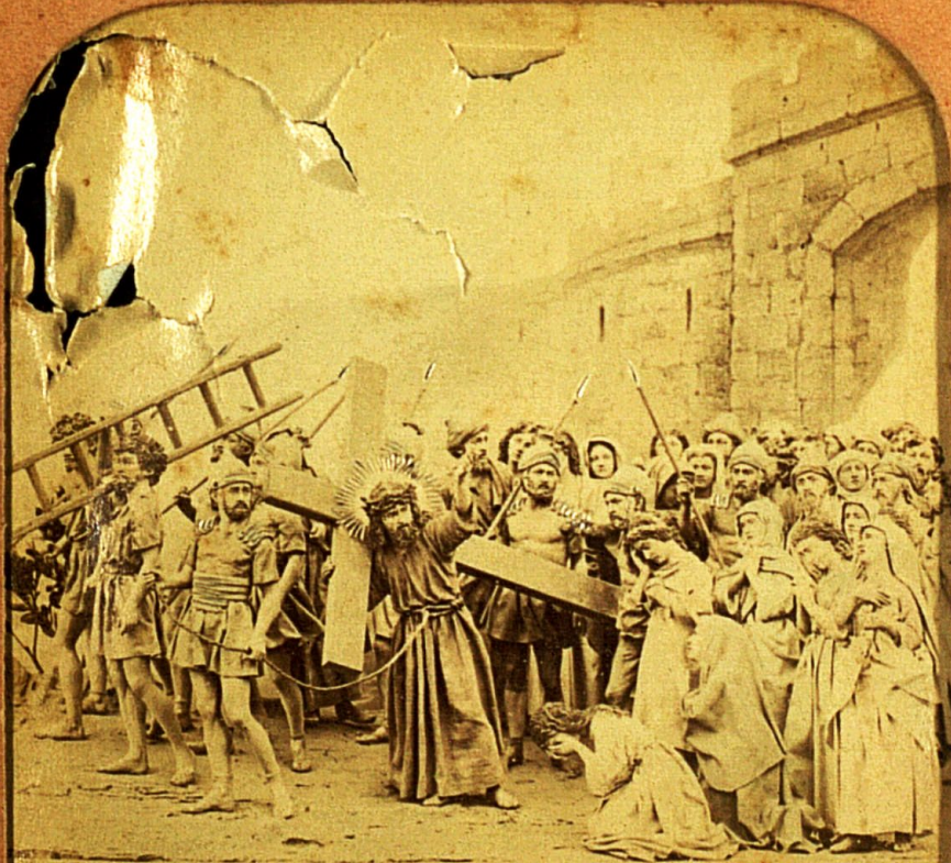
16 JÉSUS CONSOLE LES FILLES DE JÉRUSALEM VIII ME ST 2

LA VIE DE JÉSUS Illustrée par HABERT B.K. Paris