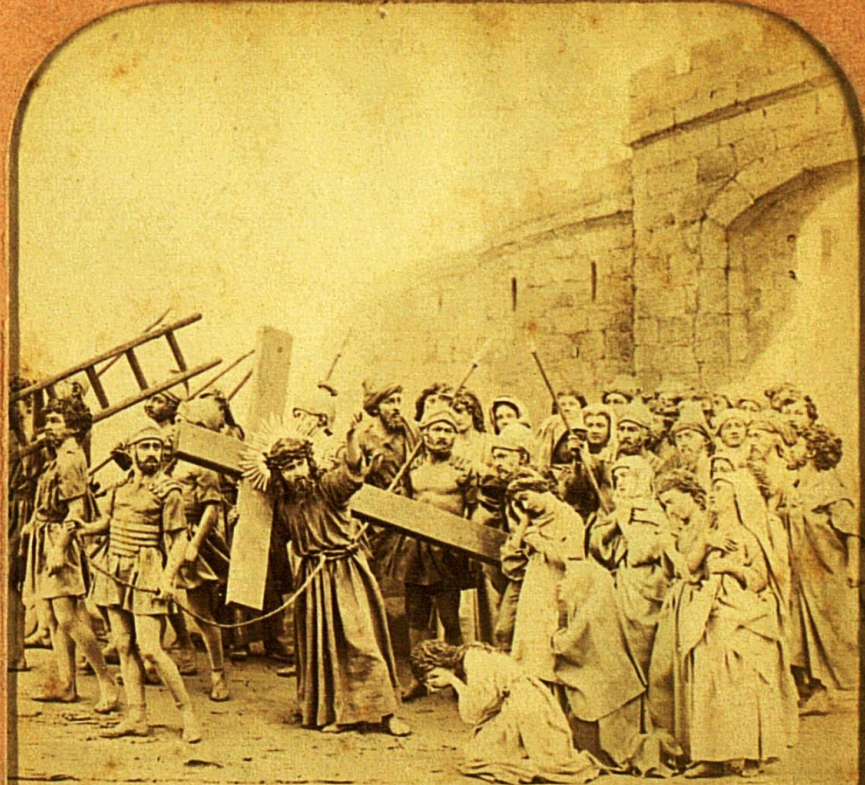
JÉSUS CONSOLE LES FILLES DE JÉRUSALEM VIII ME ST 2

LA VIE DE JÉSUS Illustrée par HABERT B.K. Paris