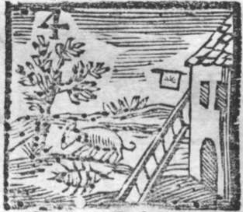
Gamberi . Scala . Osteria . Porco .