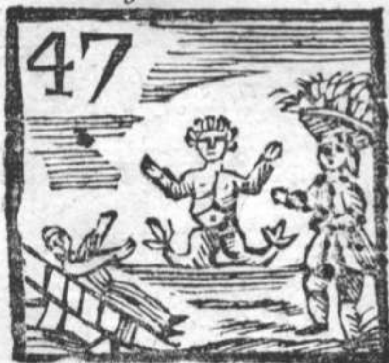
Sirena . Ortolano . Morto risuscitato .