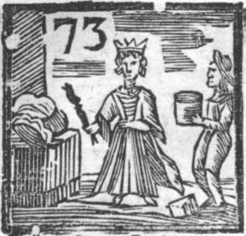
73 Scatolaro . Regina . Turbante .