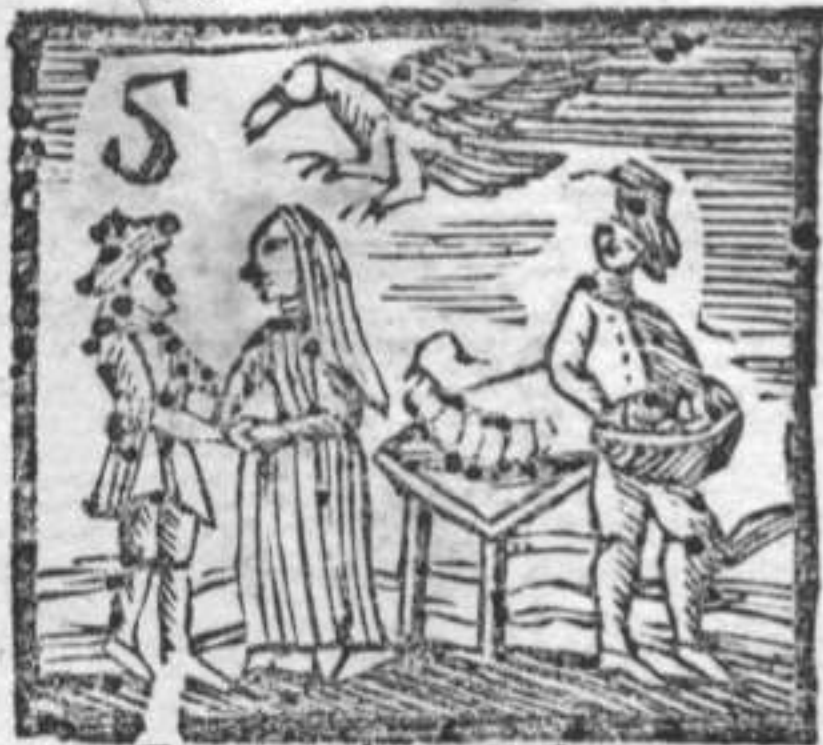
Fruttarolo . Salame . Struzzo . Zingara .