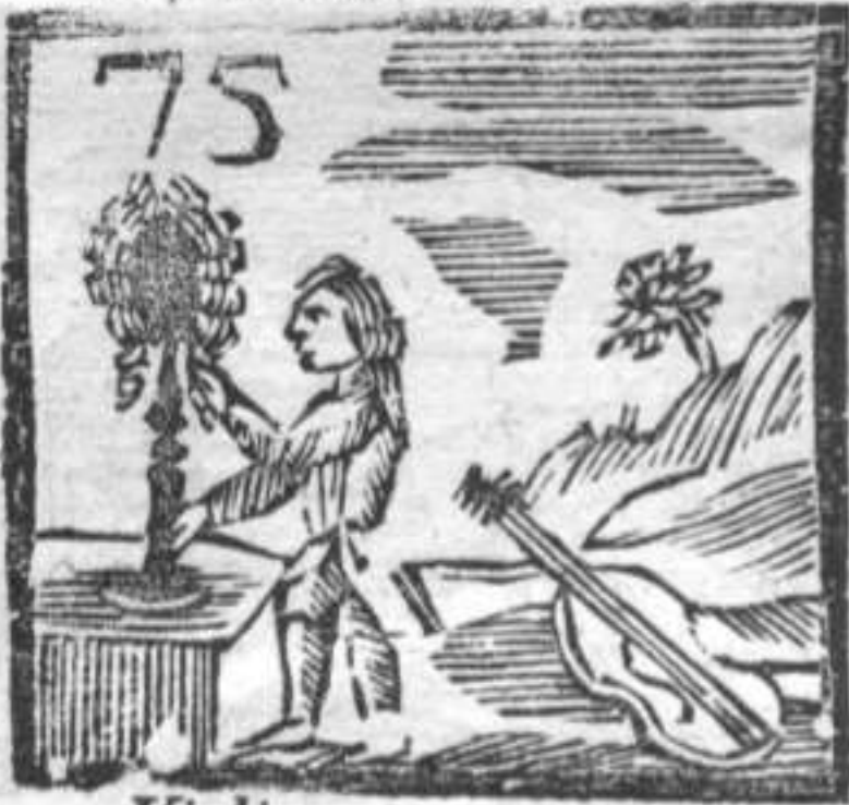
75 Violino . Parrucchiere .