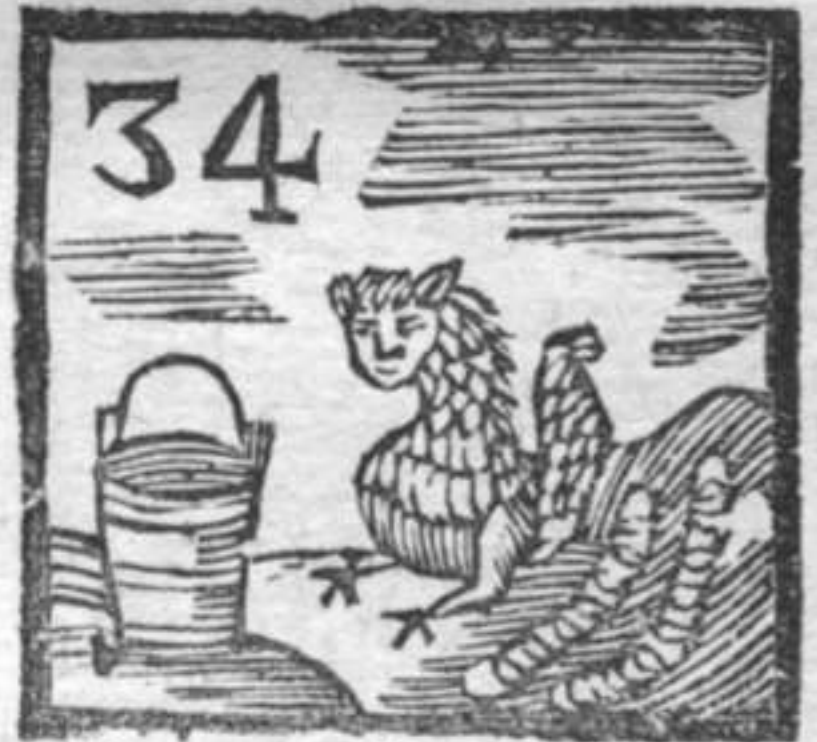
Catena . Drago . Secchio .