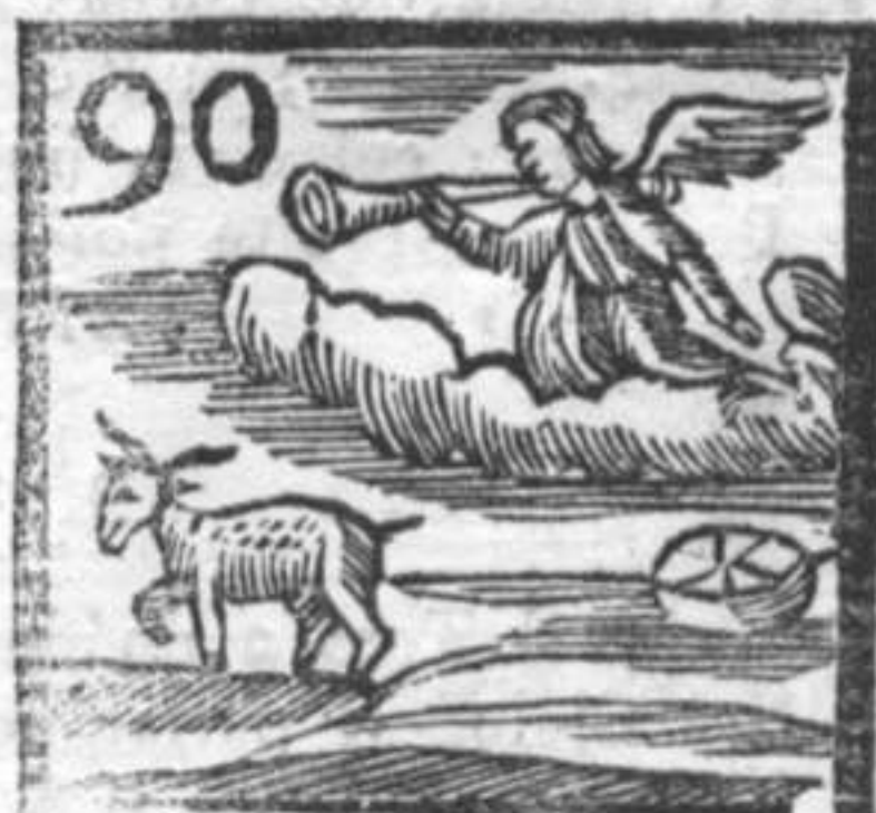
90 La fama . Orologio . Becco , o sia Mont one .