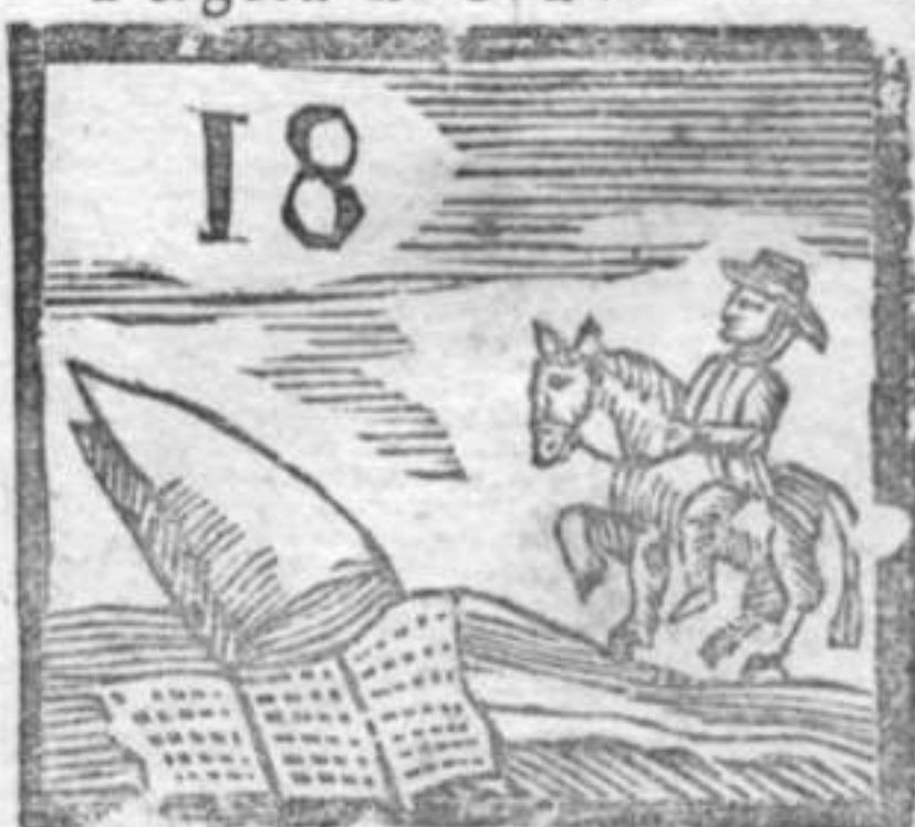
Mitra . Cavalerizzo . Lista del Lotto .