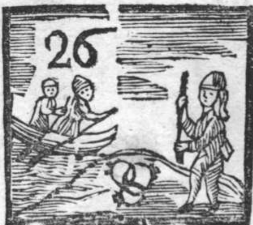
Granatiere . Anella . Barcaroli .