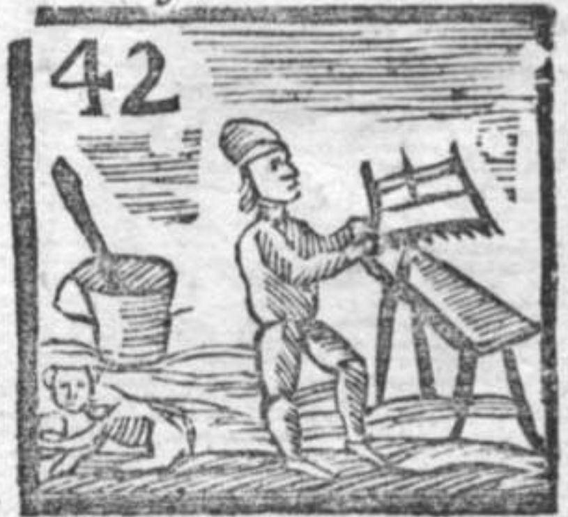
42 Mortajo . Scimia . Falegname .