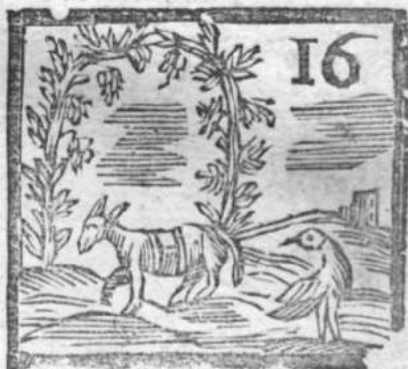
Asino . Pernice sola . Pergola d' Uva .