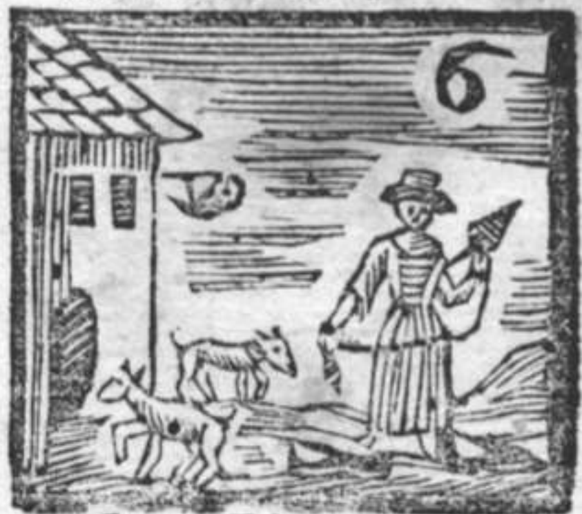
Cani . Filatrice . Posta . Pianelle .