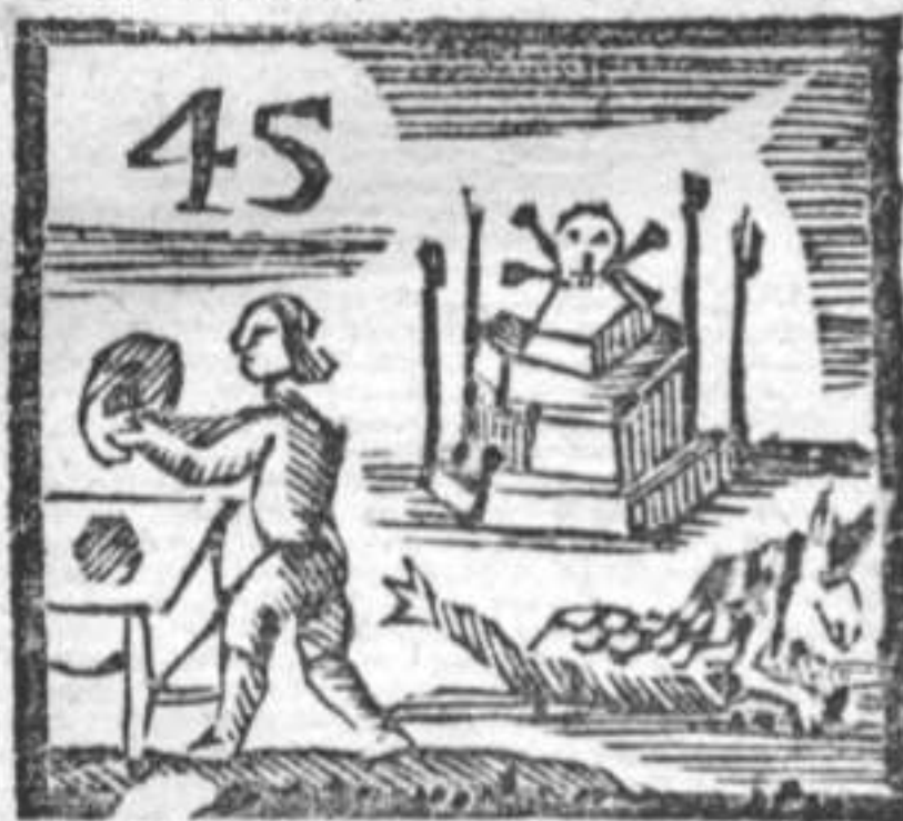
Cappellaro . Serpe . Catafalco .