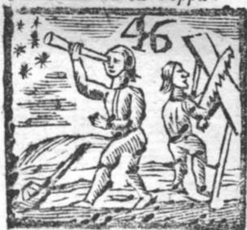
Astrologo . Segatore . Scaldaletto .