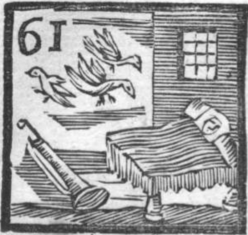
61 Ammalato . Tromba . Piccioni .