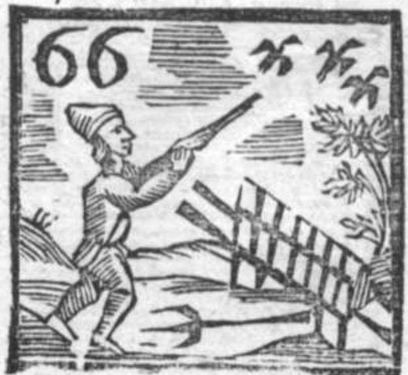
66 Forcato . Cacciatore . Barra da Morti .