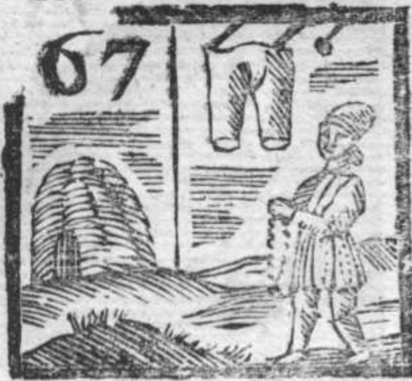
Calzoni . Cisterna . Coronaro .