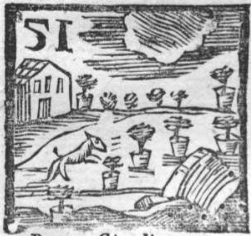
Basto . Giardino . Lenretto .