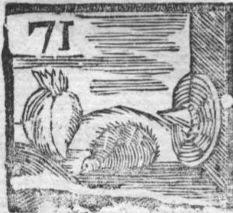
Cuore . Riccio animale . Scudo da difesa .