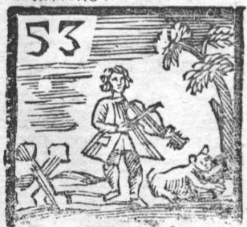
Ossi da Morto . Sonatore . Gatto bigio .