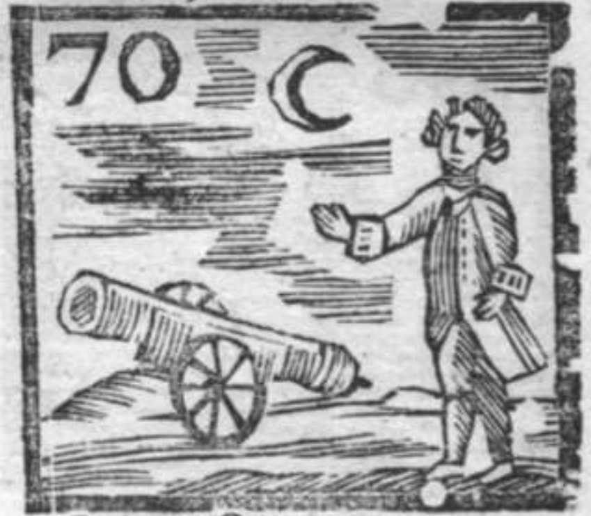
Luna . Cannone . Zerbino .