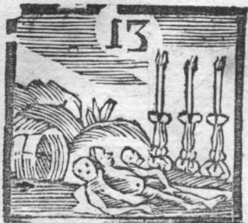
Candelieri accesi . Morti . Mercanzia .