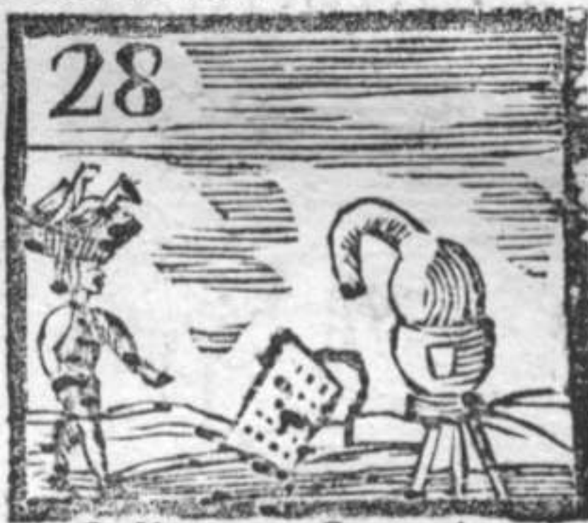
Gallinaro . Gratugia . Lambicco .