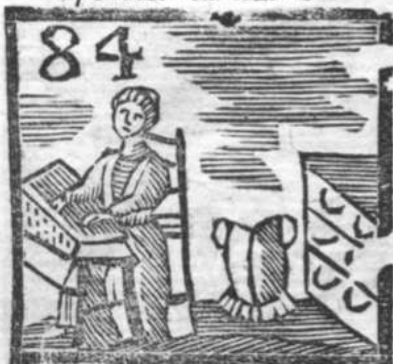
Pettina lana . Cantarano . Armatura di ferro .