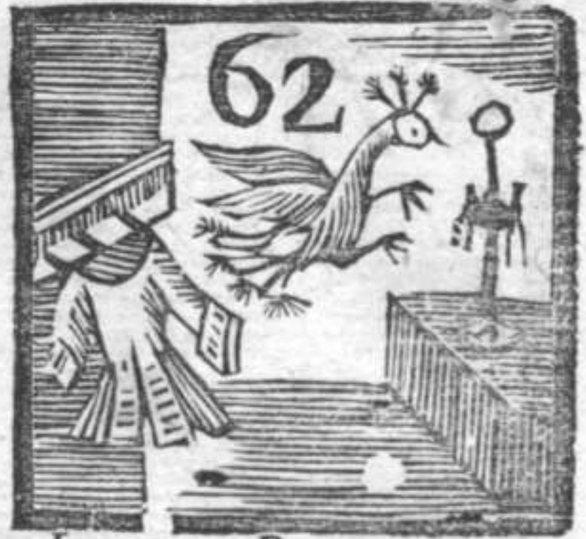
62 Lucerna . Pavone . Abito da Uomo