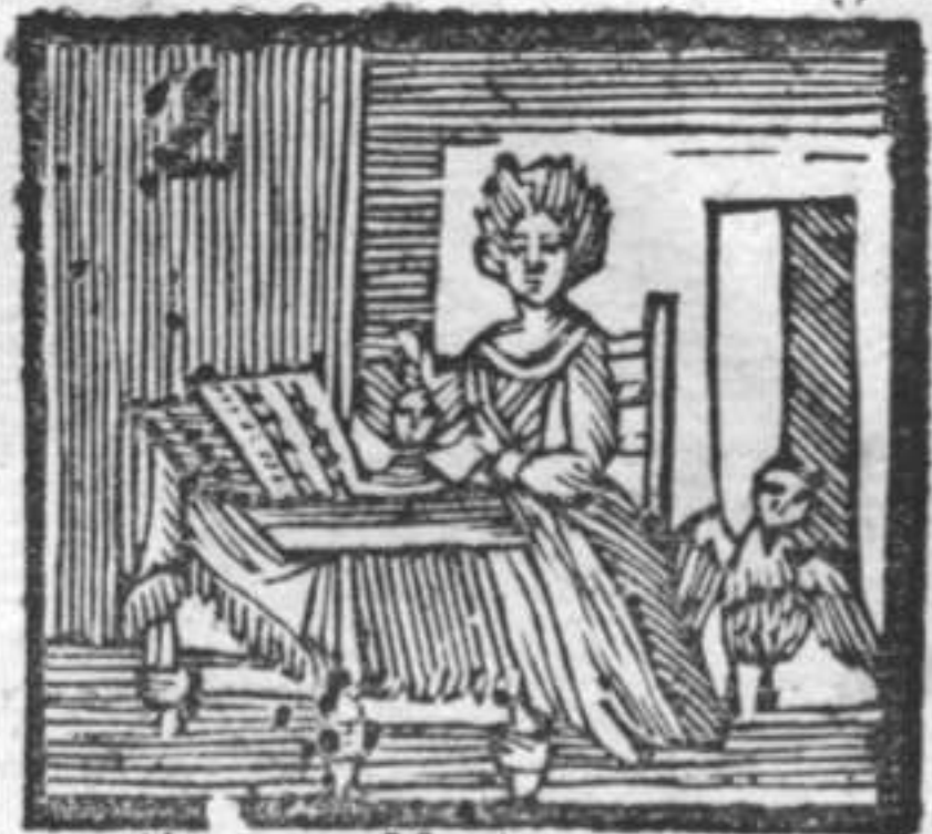
Alocco . Musica . Scuffiara .