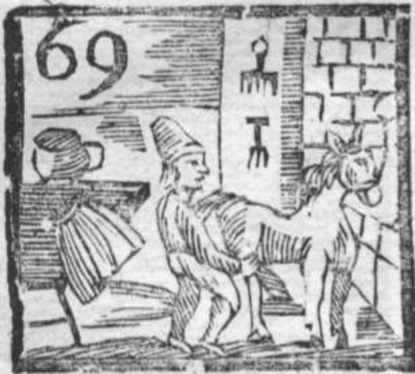
Tentatore . Sottanino . Ferra Cavalli .