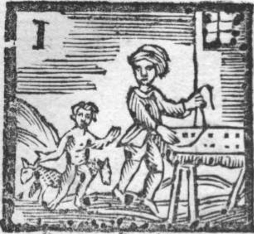
Pecore . Bambino . Mottarazzo .