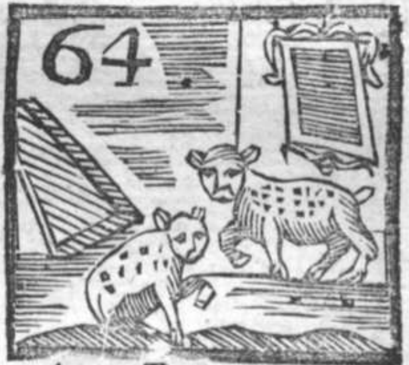
64 Arpa . Tigri . Specchio .