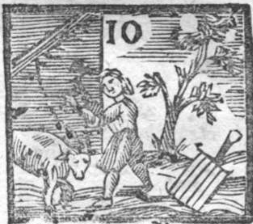
Graticola . Alberi . Macollaro .