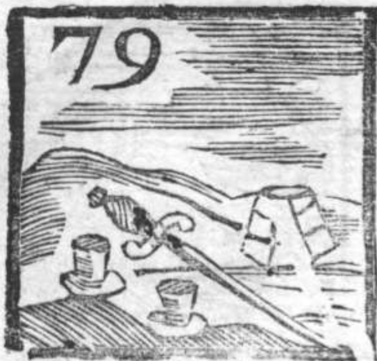
Spada . Chicchere . Guardinfante .