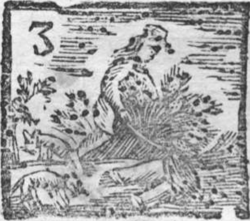
Mietitore . Braghe . Gatti .