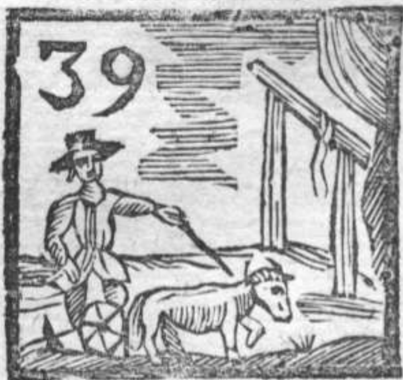
39 Uomo che ara . Forche . Padiglione .