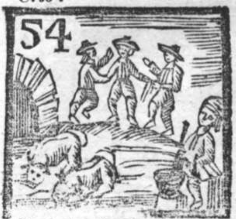
Bovi dormienti . Sinagoga . Speciale .