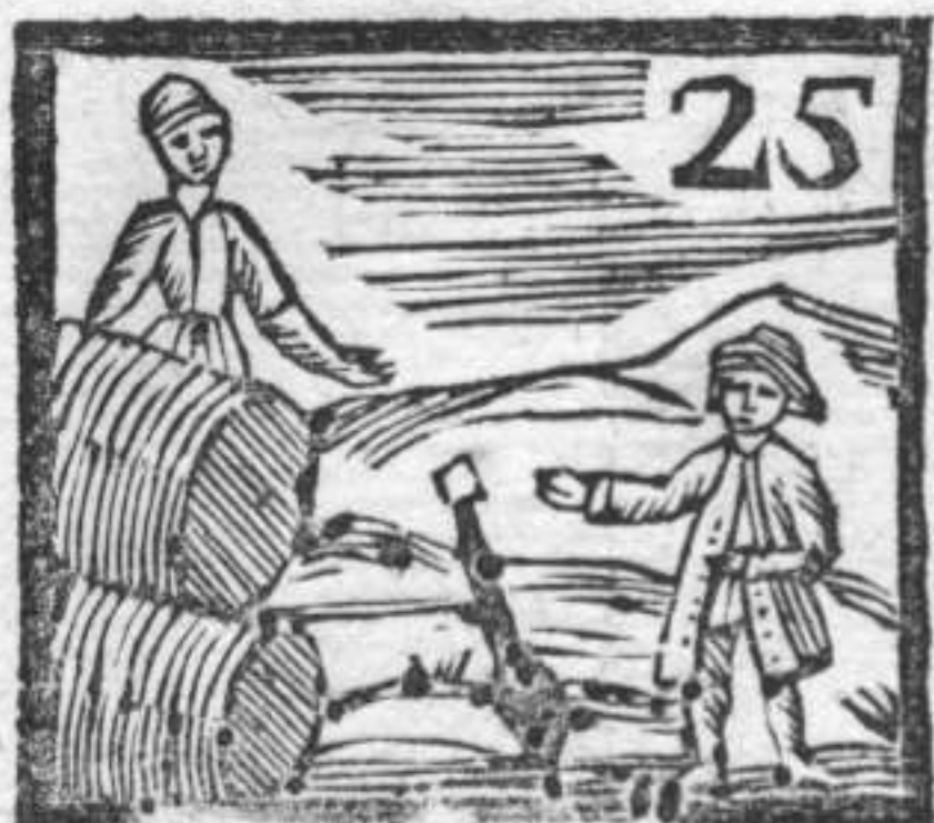
Oliaro . Bracciere . Battaglio di Campana .