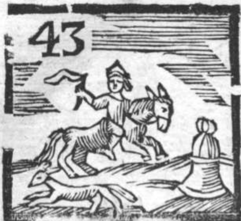
Campana . Volpe . Corriere .