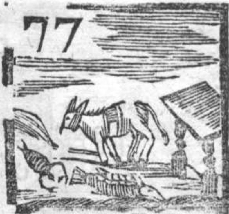
77 Scorpioni . Un Pesce . Mulo . Tavolino .