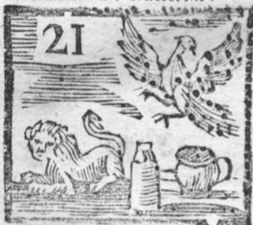
Ovinale . Sorbetti . Lione . Aquila .