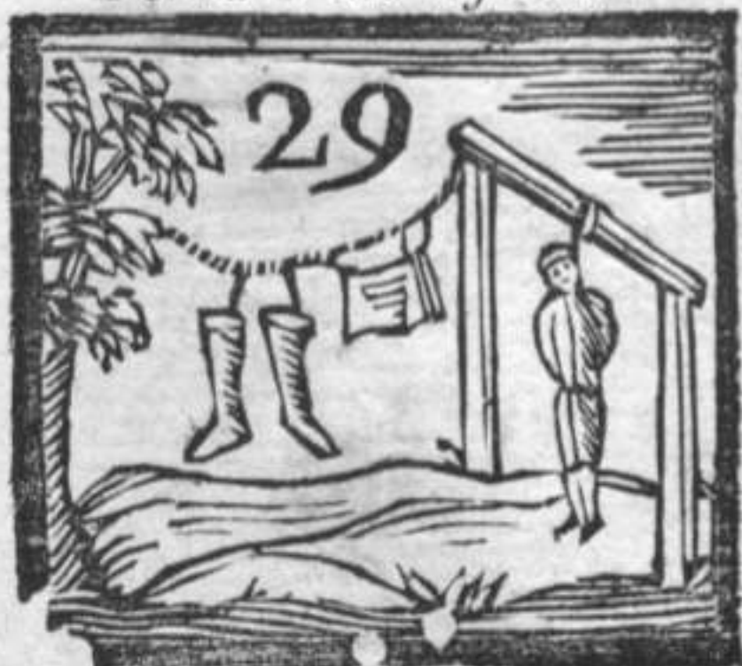
Calzette . Busto . Impiccato .