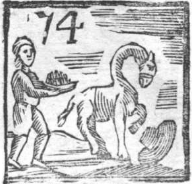
74 Capello Camello . Vendi Sale .