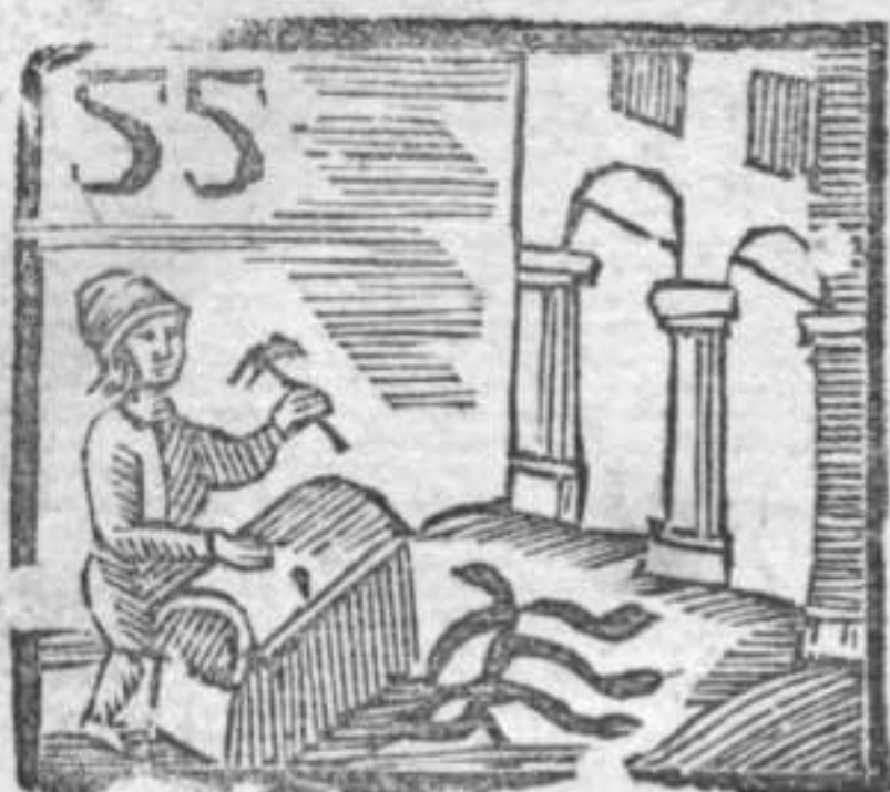
Baularo . Serpi . Sottoportico .