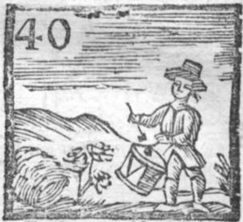
40 Tamburino . Manicotto . Fiori freschi .