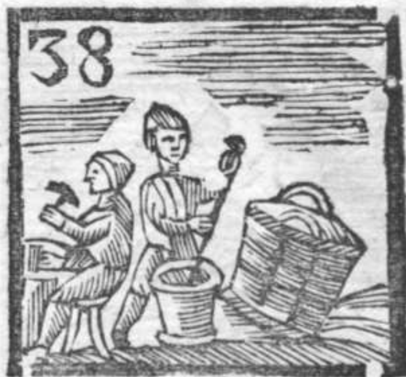
38 Sporta . Pistello . Battiloro .