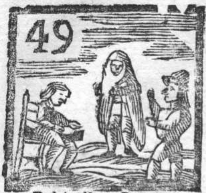
Pulcinella . Bavutta . Calzolaro .