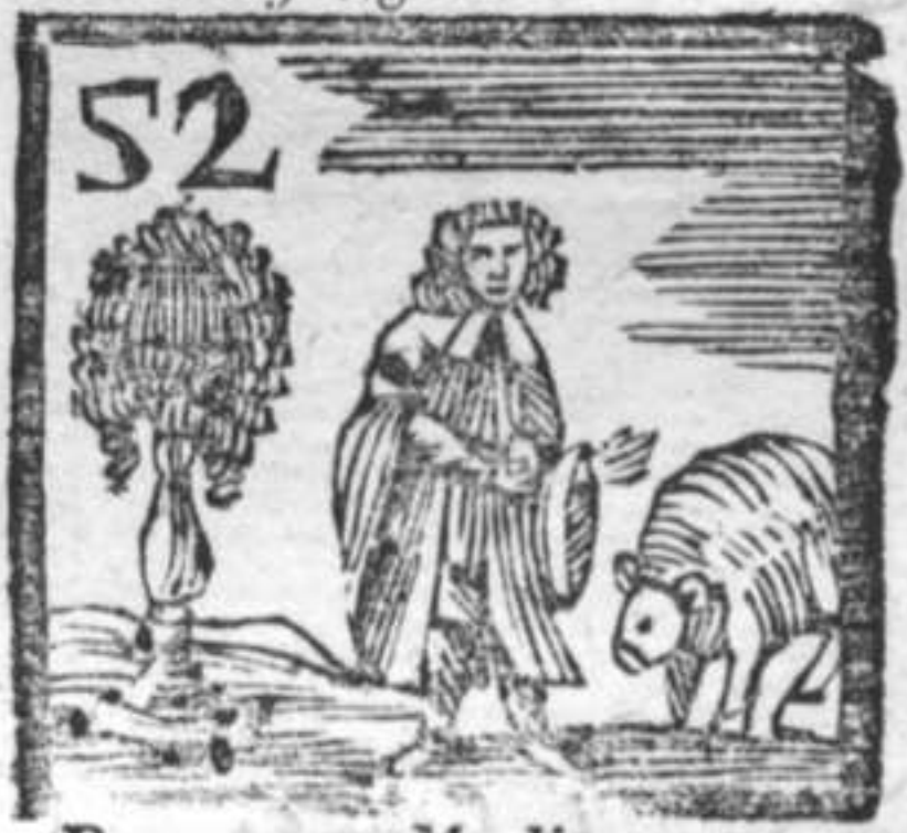
Parrucca . Medico . Orso .