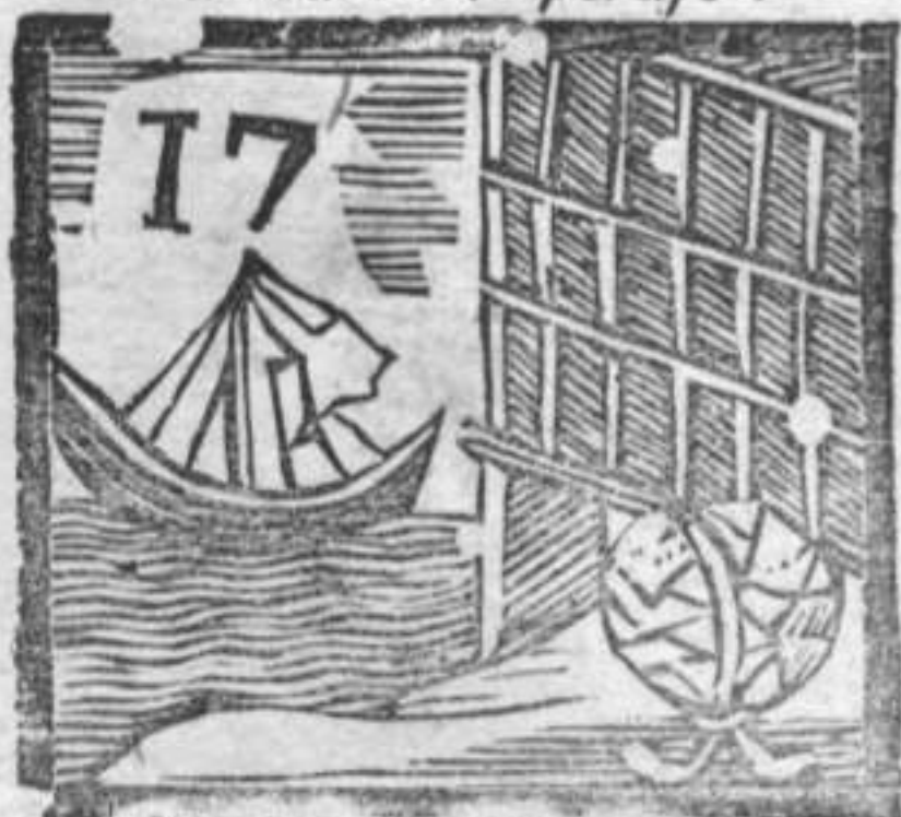
Gondola . Libreria . Mappamoudo .