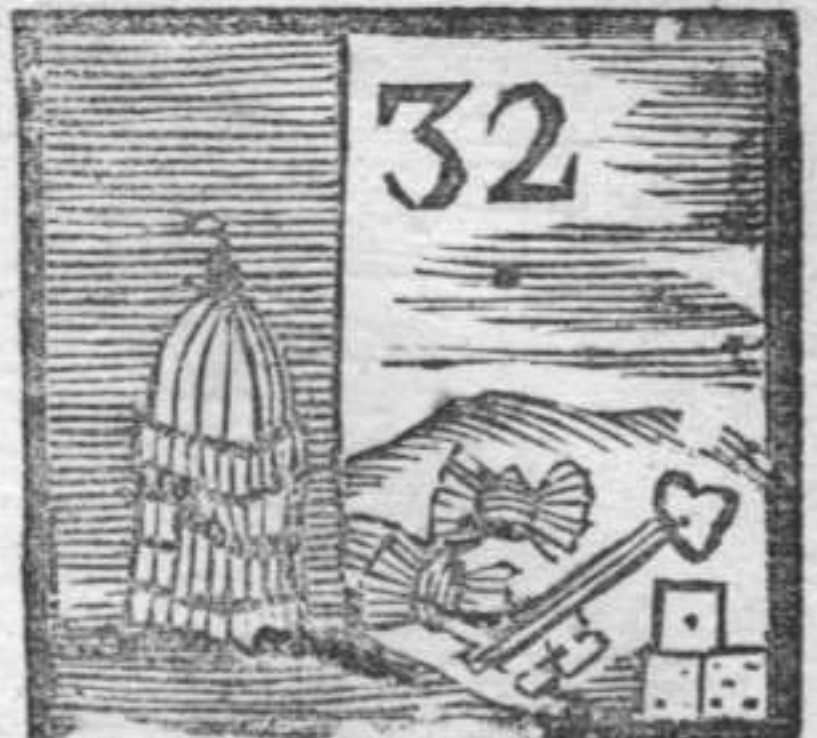
Chiave . Scuffia . Dadi . Gabbia .