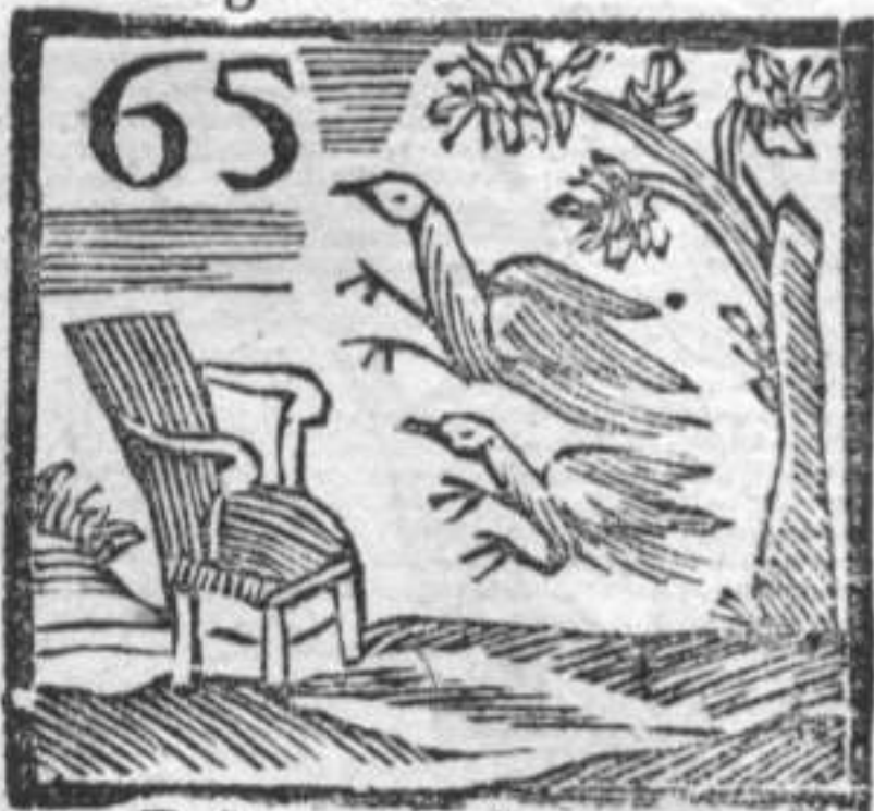
65 Poltrona . Struzzi . Albero .