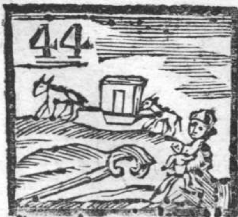
Pastorale . Lettiga . Balìa che dà la Poppa .