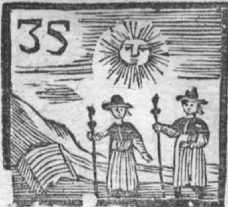
Sole . Sella . Pellegrine .