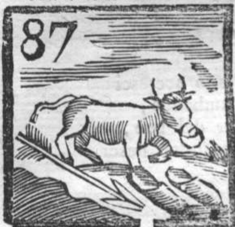
87 Buffala . Pianelle . Freccia .