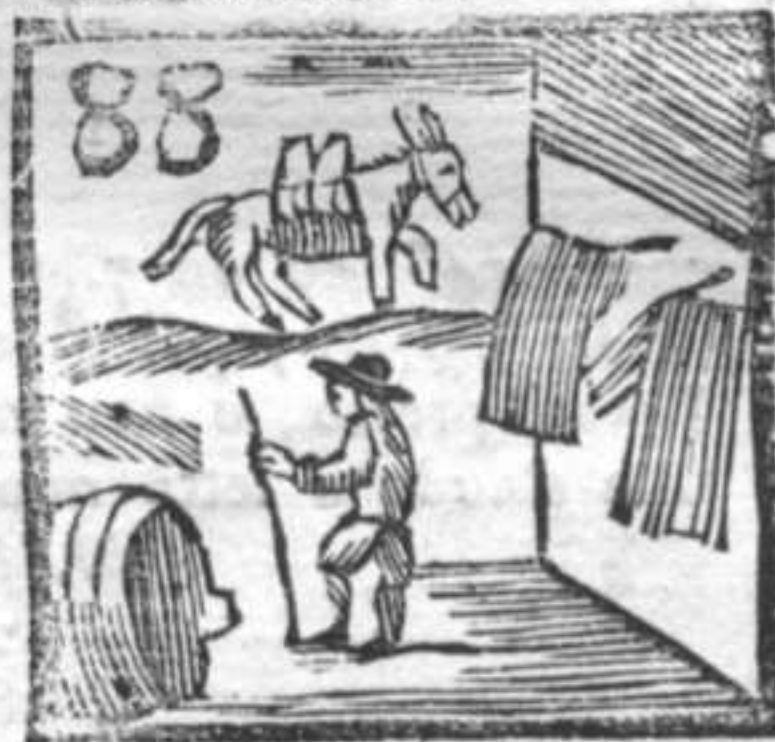
88 Bottaro . Camicie . Mulattiere .