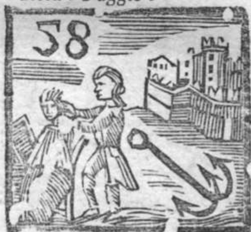
Fortezza . Ancora . Conciateste .