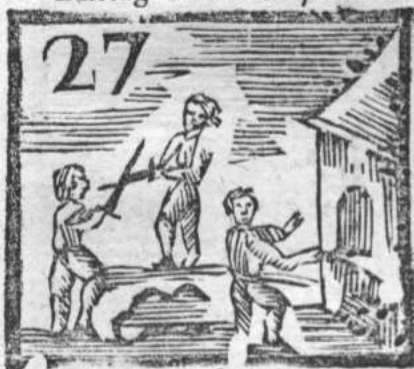
Duello . Salsiccia . Fornaro che inforna .