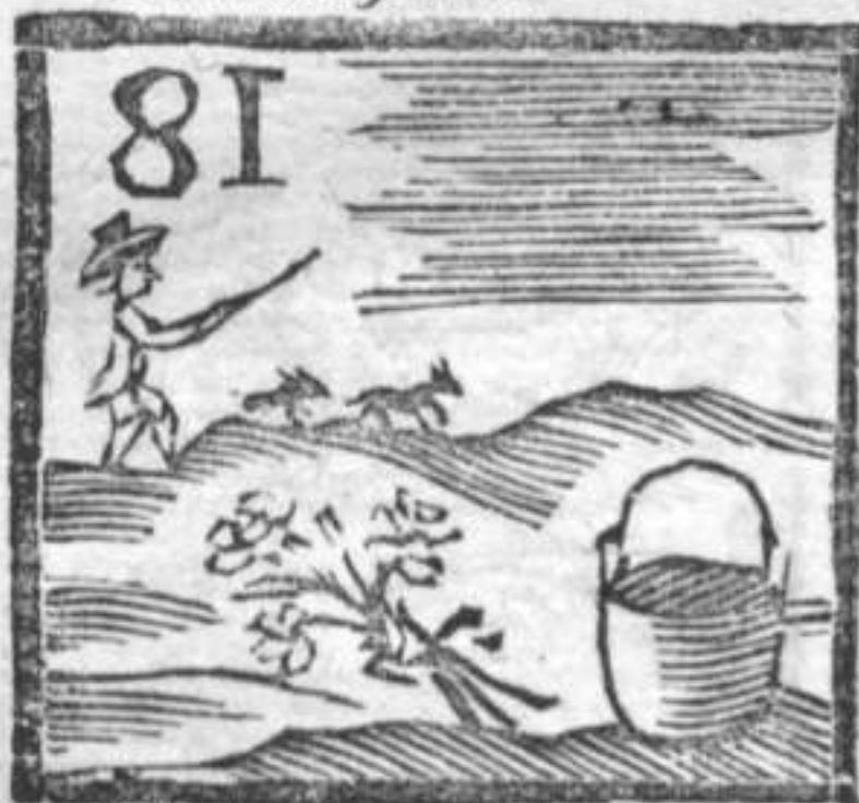
Capretajo . Caldara . Mazzo di Fiori .