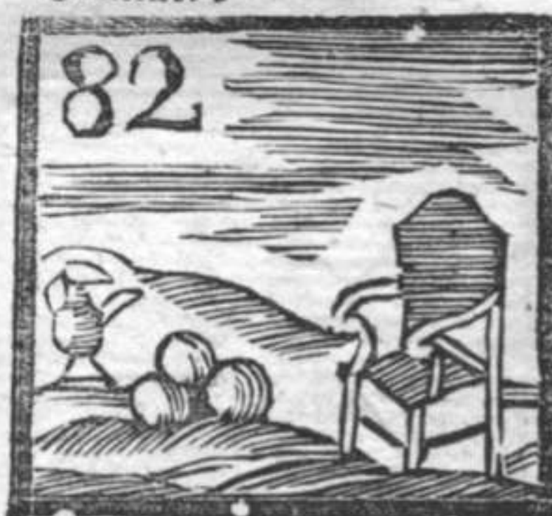
Orcio da olio . Carrega . Saponette da Barba .