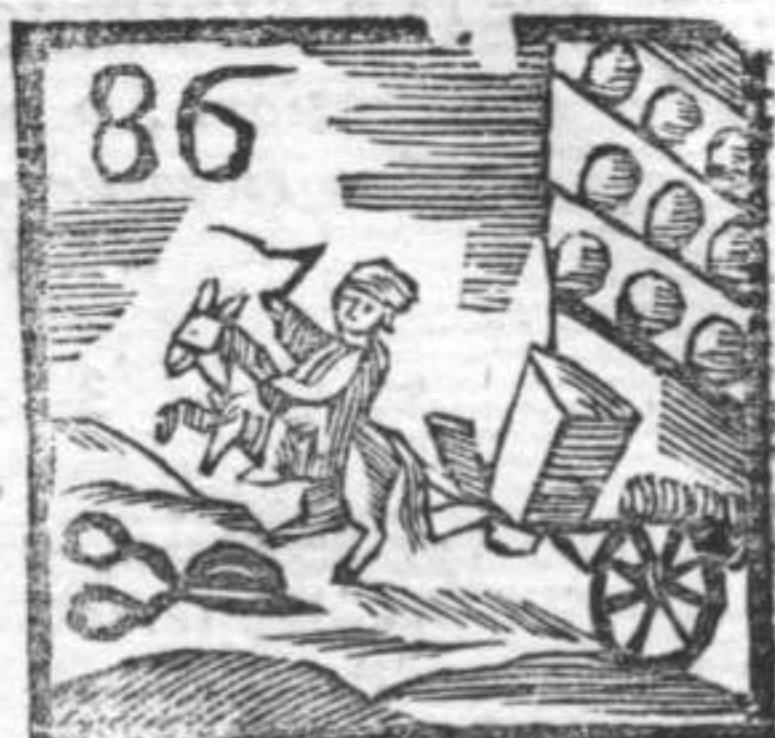
86 Vetturino . Scuffette . Smacciatore .