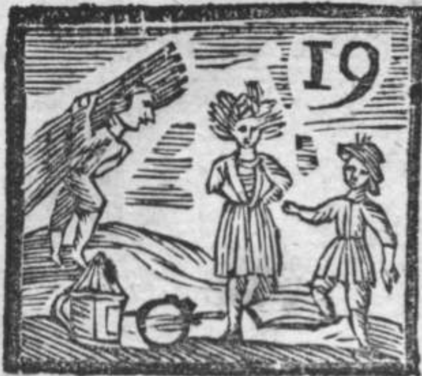
Anello solo . l'acchino . Lantern . Ballerini .