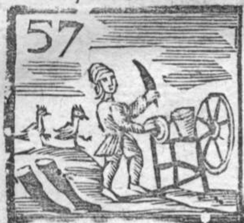
Stivali . Galline . Arrotatore .