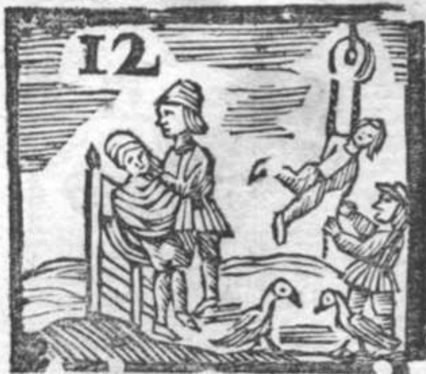
Barbiere . Oche . Paziente alla Corda .