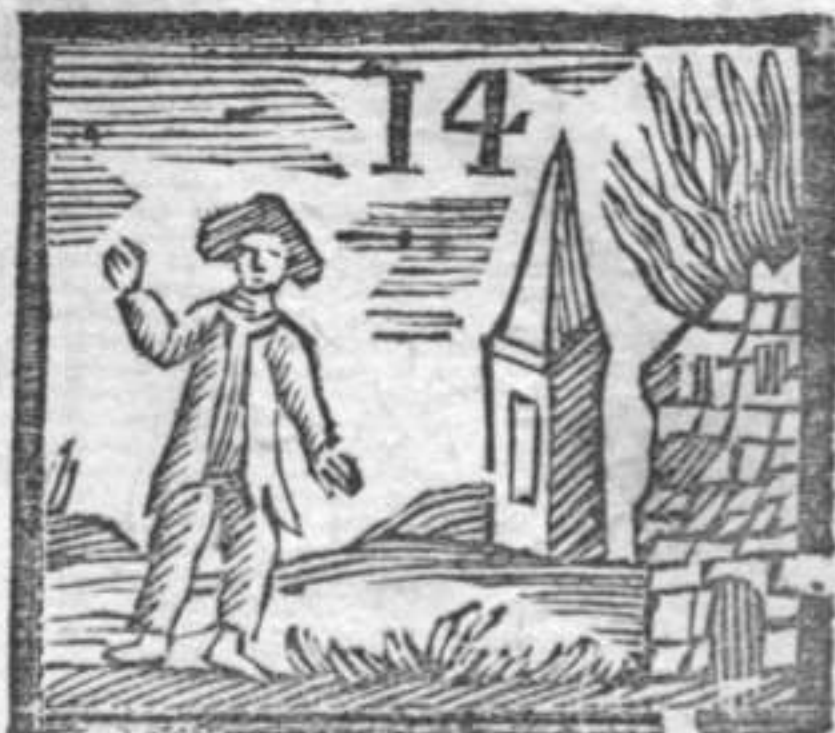
Spazzacamino . Obelisco . Fuoco incendio .