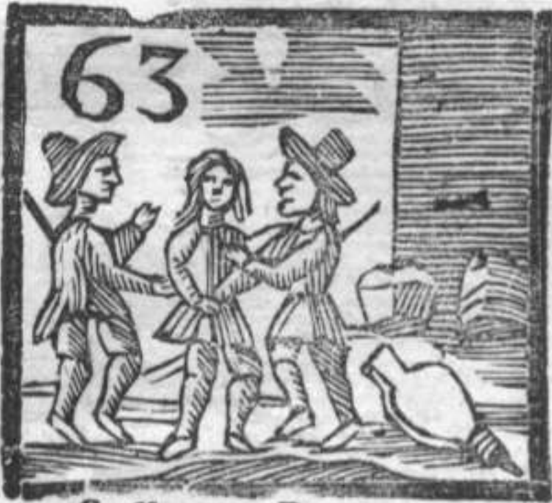
63 Soffietto . Beretta . Prigioniero .