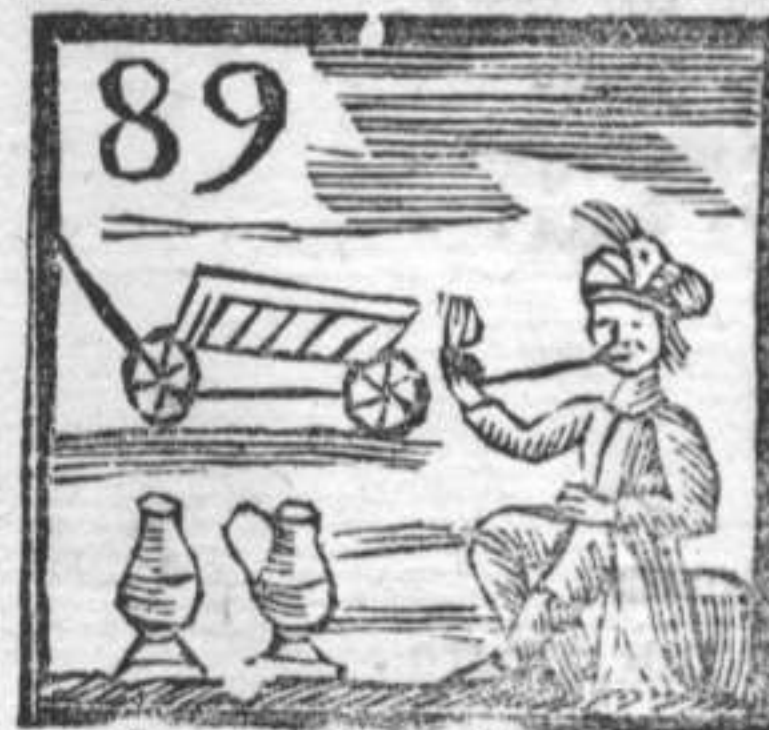
89 Carro . Caraffe . Gransignore Turco .