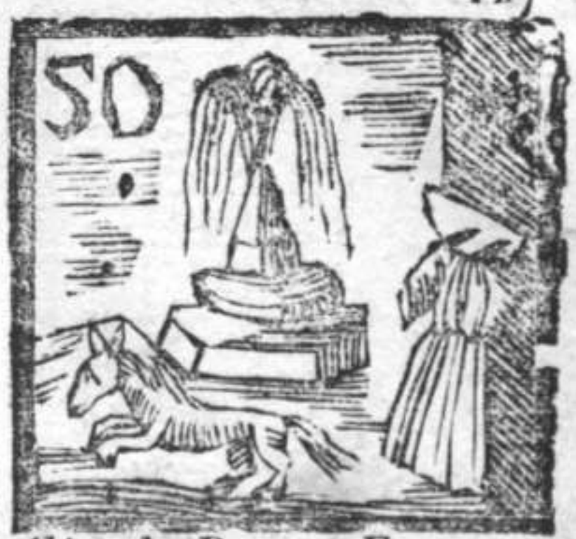
Abito da Donna . Fontana . Cavallo fuggitivo .