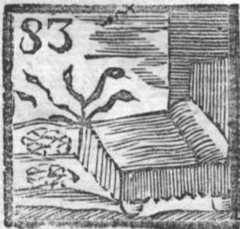
Letto . Pigne . Serpenti .