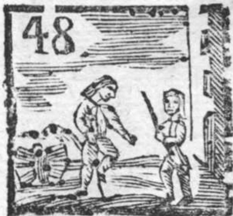
Scuffia . Zoppo . Sentinella .