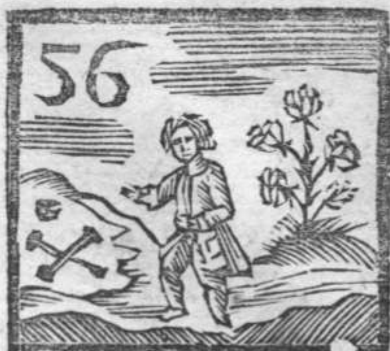
Fossa di Morti . Rosa . Paggio .