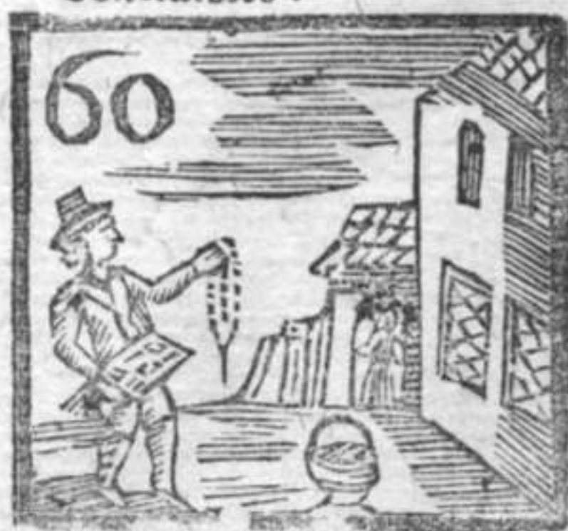
Grate di Monache . Brocca . Vezzo di Coralli .