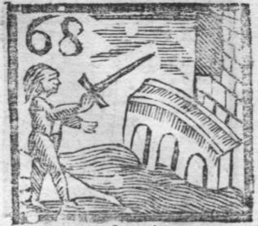
Soldato che minaccia . Ponte , e Fiume .