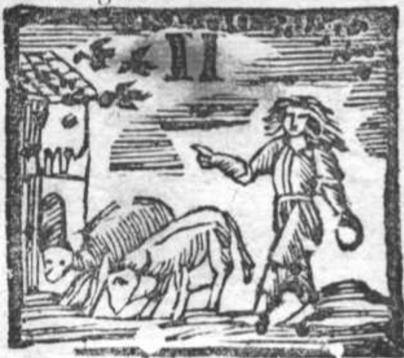
Bovi in ziedi . Colombara . Contadino .