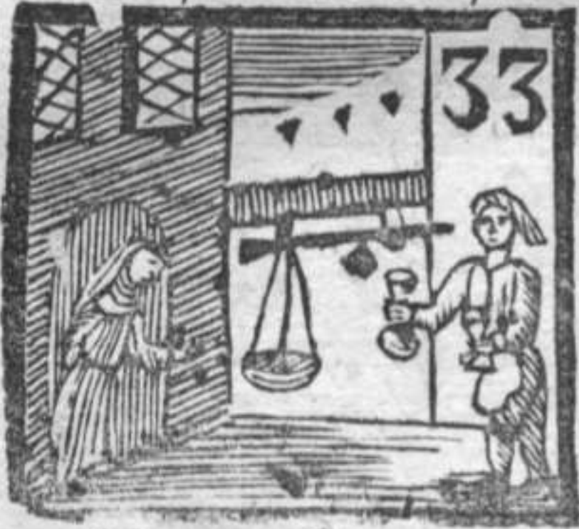
Monaca . Oste . Bilancia .