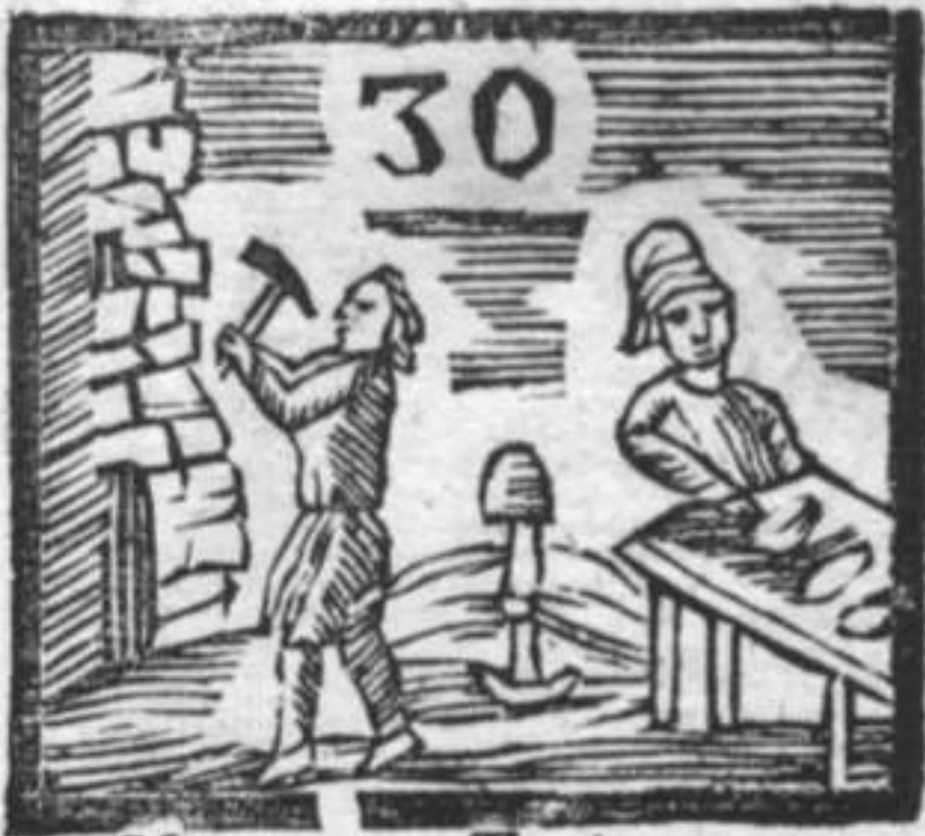
Muratore . Testiera . Formaggiaro .