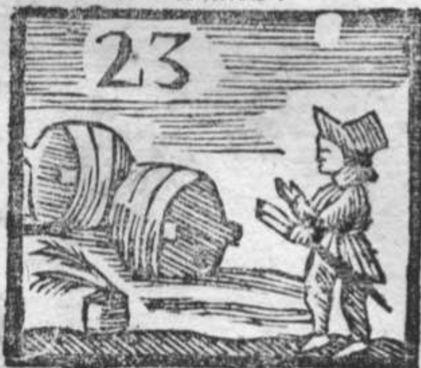
Calamaro . Botti , Birro solo .