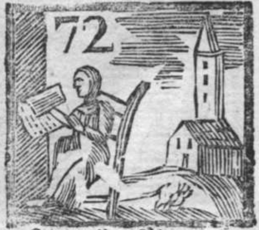
Campanile . Chiesa . Pettina Bavella .