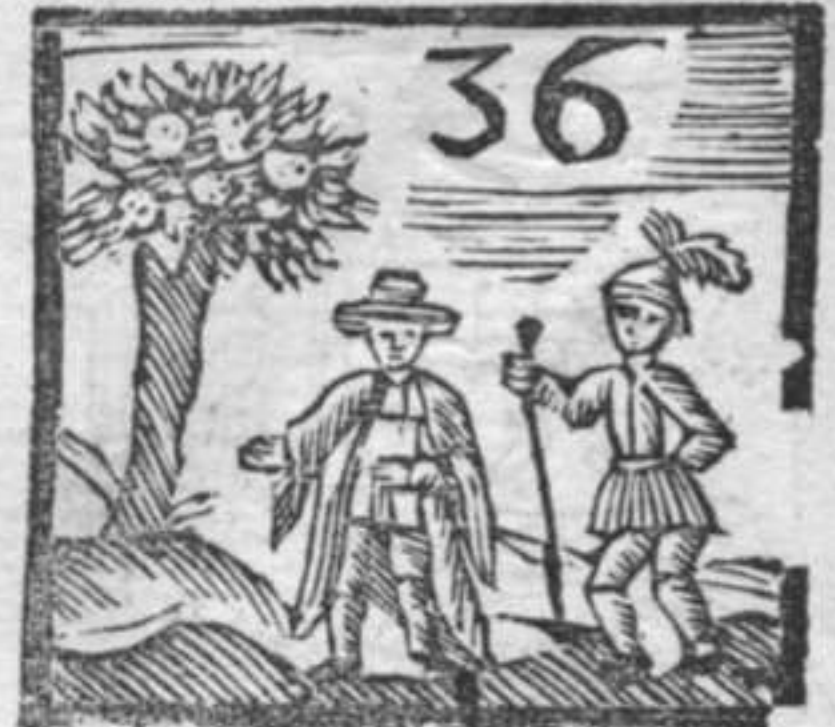
Dottore . Arbore Pino . Volante, o sia Lacchè .