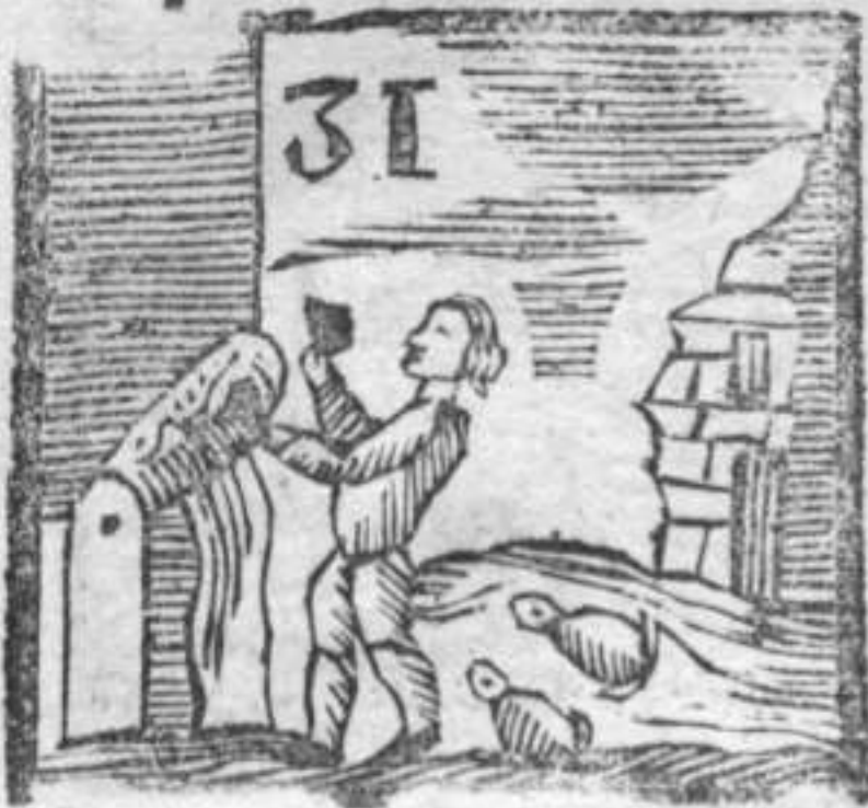
Ranocchi . Stampatore che stampa . Casa dirupata .