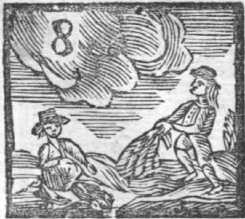
Pollarolo . Nuvole . Pescatore con Rete .