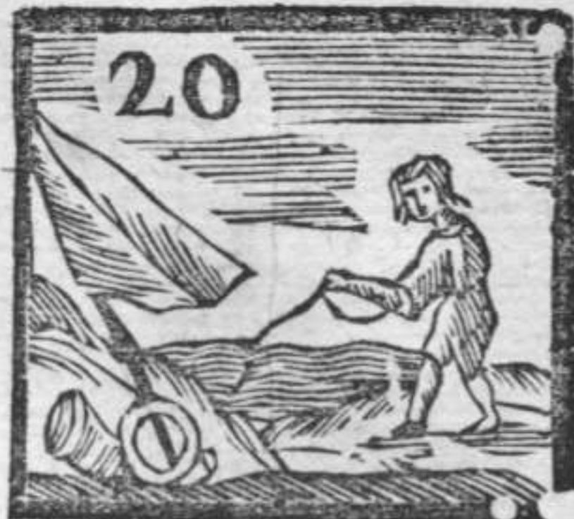
Corno da caccia . Bandiera . Pescatore .