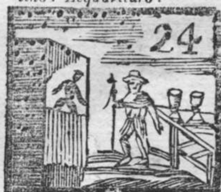
Burattini . Pellegrino . Bicchieri di Cristallo .