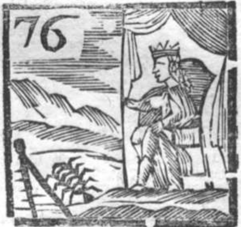
76 Re . Compasso . Granchio .