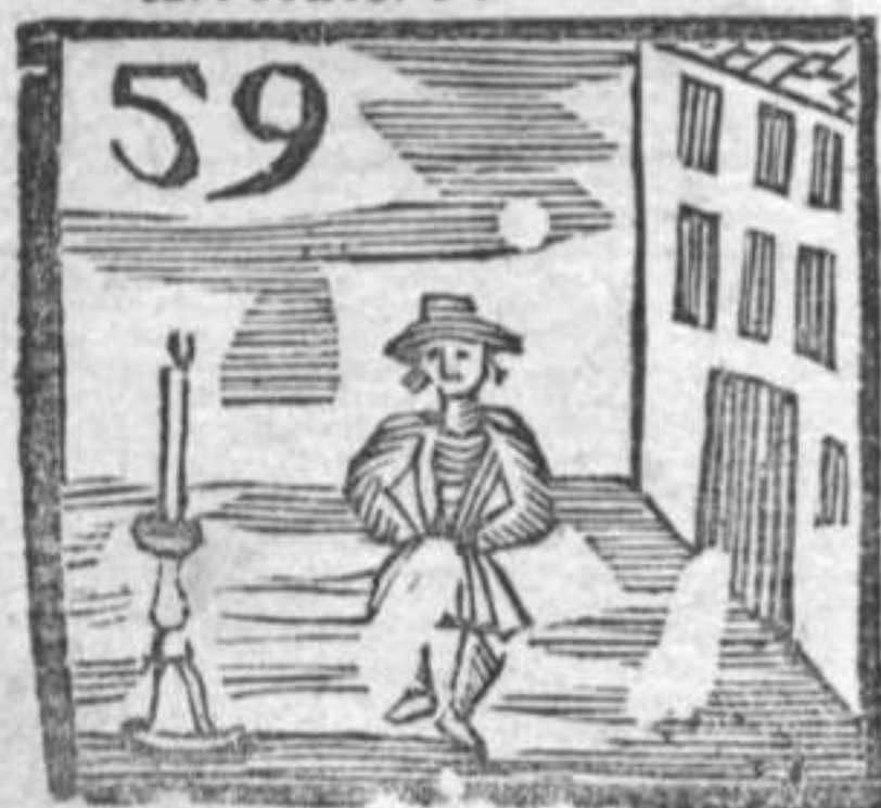
Casa . Ballerino . Candeliere .