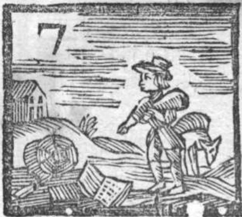
Libri . Scrimaglio . Scopetta • Carbonaro .