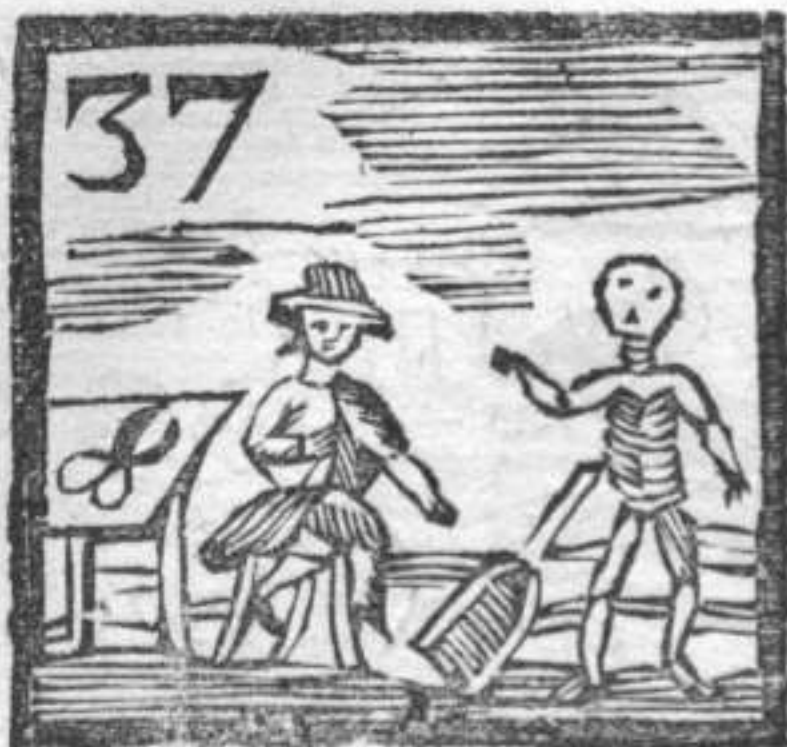
37 Morte . Sartore . Palazzo da Biade .