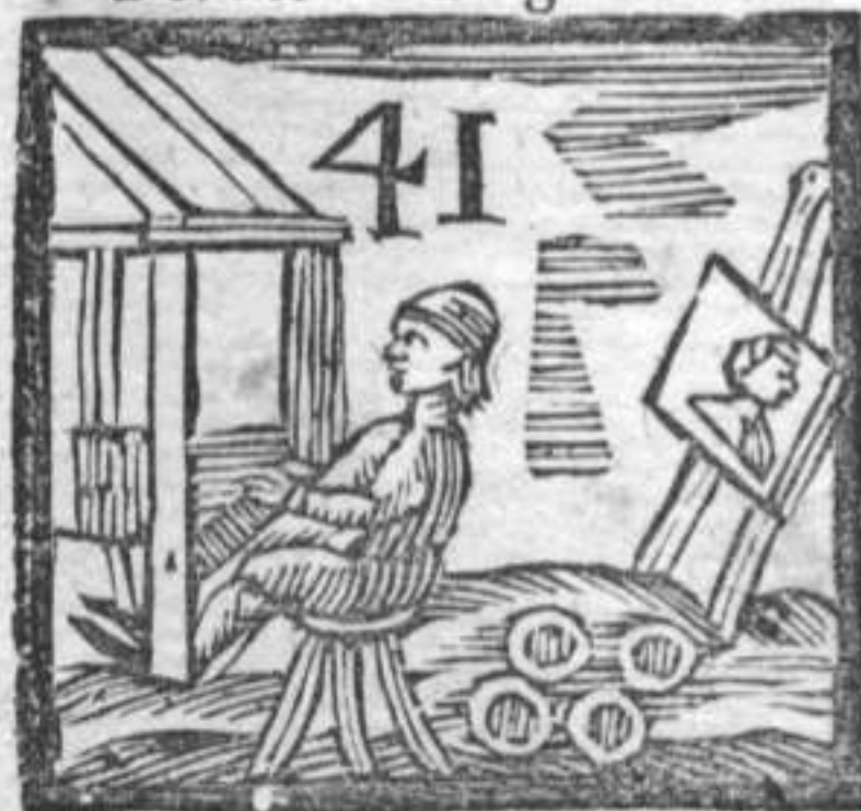
41 Tessitore . Pittura . Scodelle .