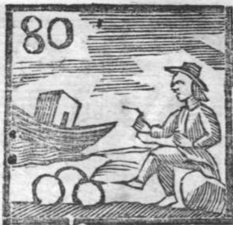
Barca . Sartore . Oochiali .