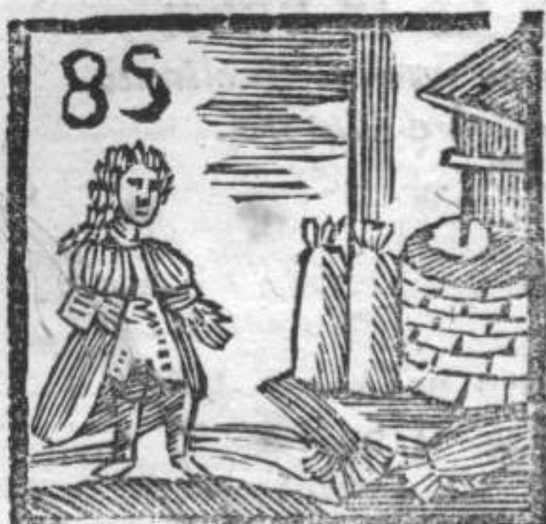
85 Mulino . Senatore . Manichetti .