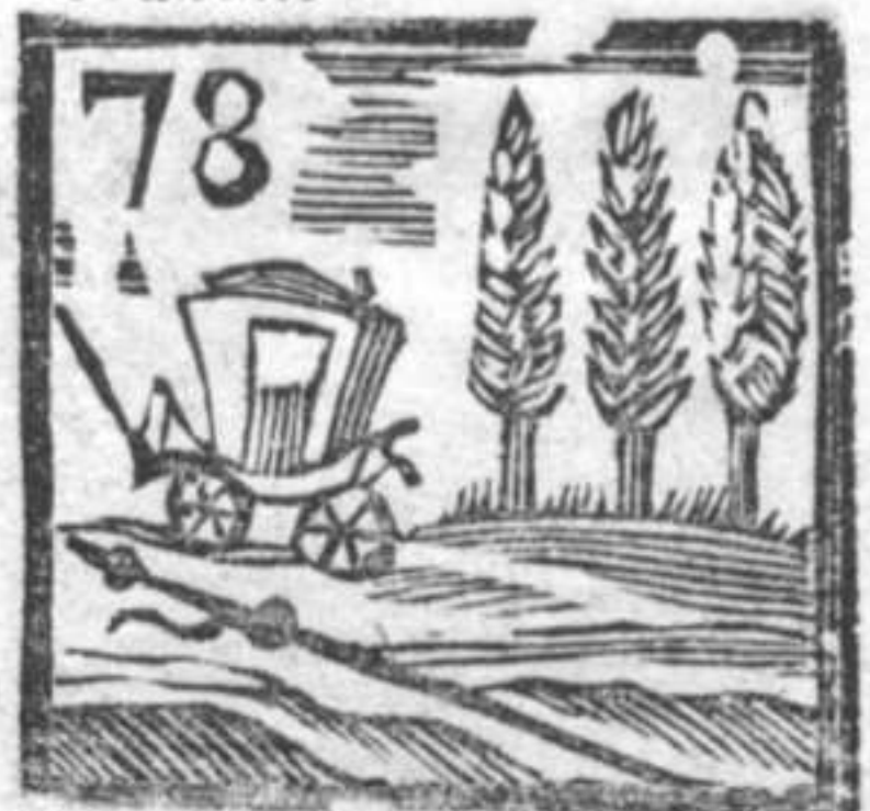
78 Carozza . Cipressi . Bordone da Pellegrino .