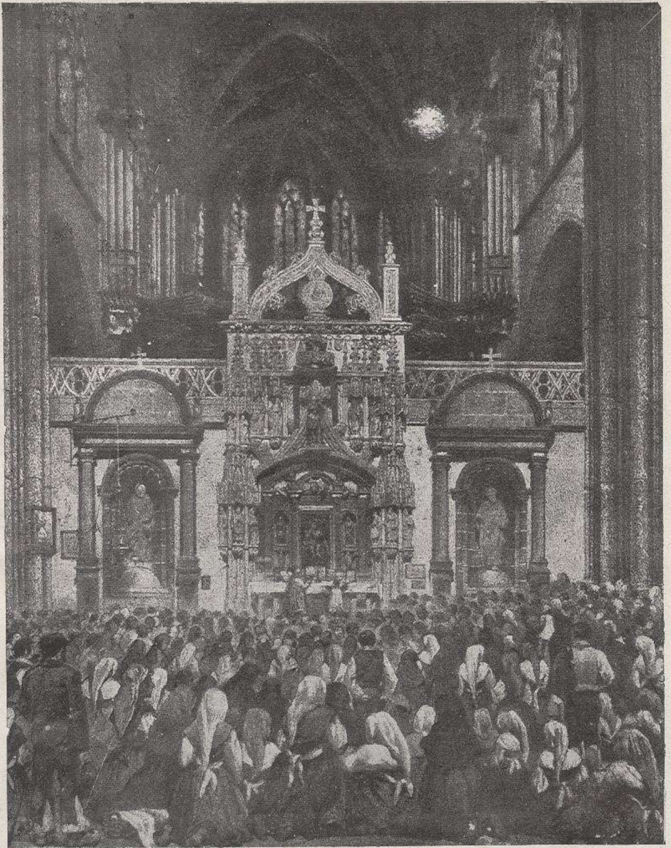
Oviedo = Cathedral. = Altar de N ra S ra de la Luz. = Trascoro ant o .