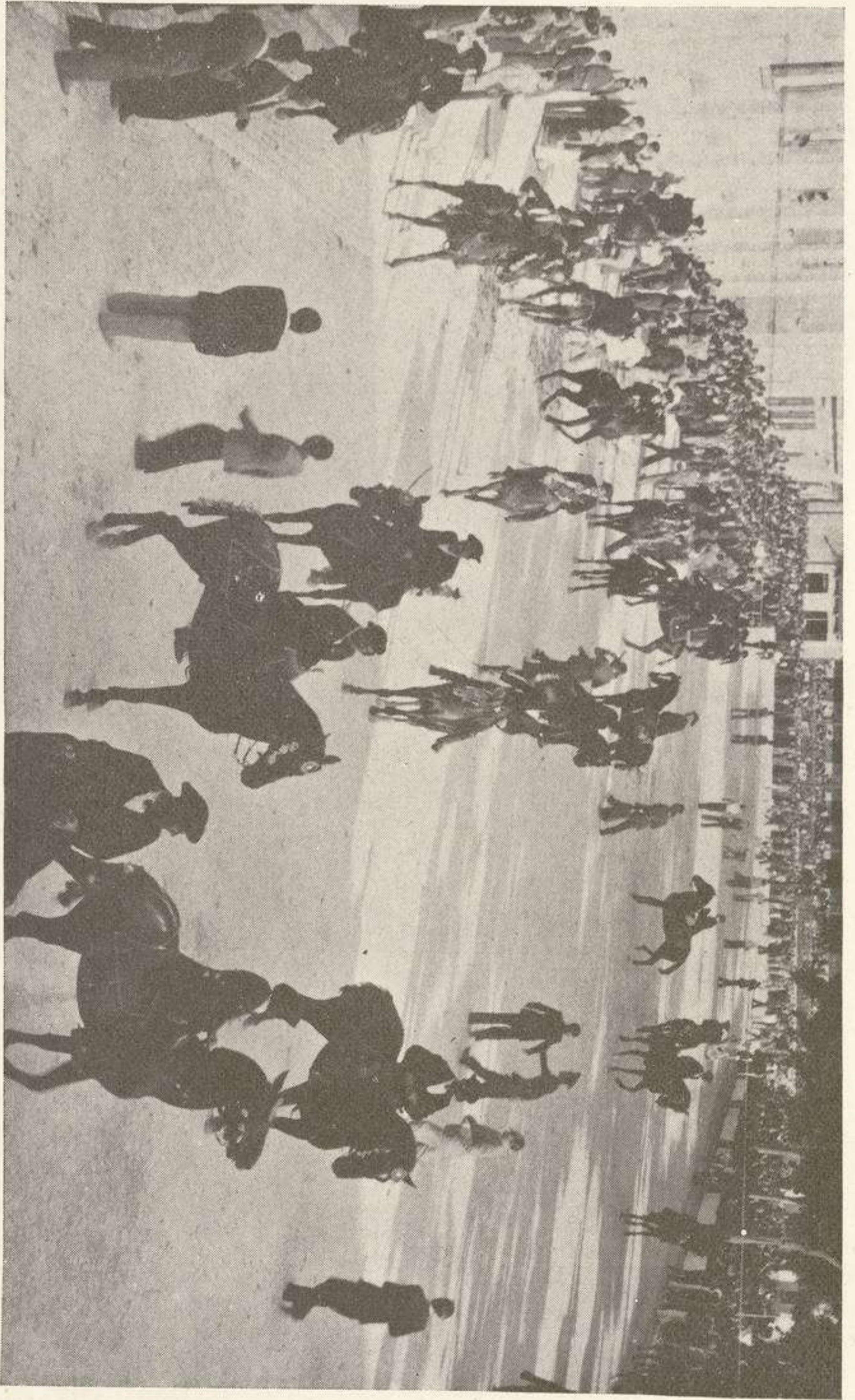
«Caragol des Born» en la vigilia de San Juan (1943)