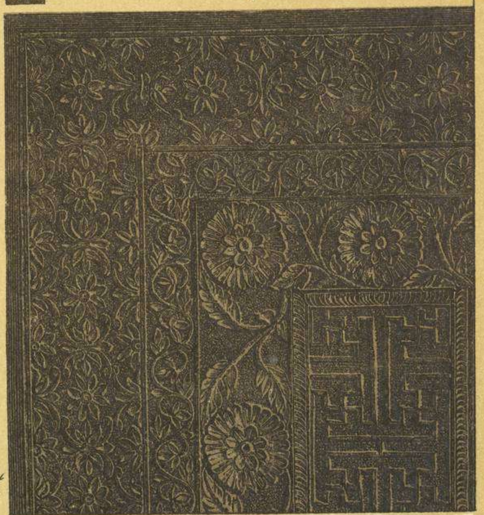
EDAD MEDIA Y MODERNA.—OBJETOS SAGRADOS Y MUESTRAS DE ORNAMENTACIÓN DE LOS INDIOS