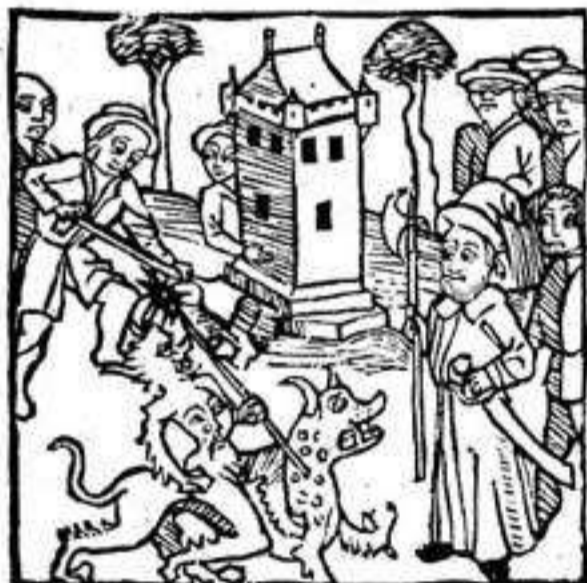
Incipit liber primus in quo continentur tres considerationes

fensione tue sanctissime fidei. In quo quod quid benedictum inueniat tibi tribuat a quo omne bonum est. Si quid vere minus caute dictum fuerit benivolentem peto correctorem in omnibus me submittens determinationi ecclesie catholice tue immaculate spose. Sumens in tuo nomine fundamentum nostri expugnabilis fortalicij verbum passumptus. Turres fortitudinis a facie inimici. ps. lx. Et premitur figura pugne in qua fortalicium quinquaginta turrium cum ei ornatum et armatura deseruit primo libro. Heretici fodientes sive per inuicem fortalicium perforantes deseruiunt secundo. Iudei vero signati velati et catenis vinculati deseruiunt tertio. Bellum sarracenorum et christianorum deseruit quarto. Demones vero ab angelis prostrati deseruiunt quinto libro.