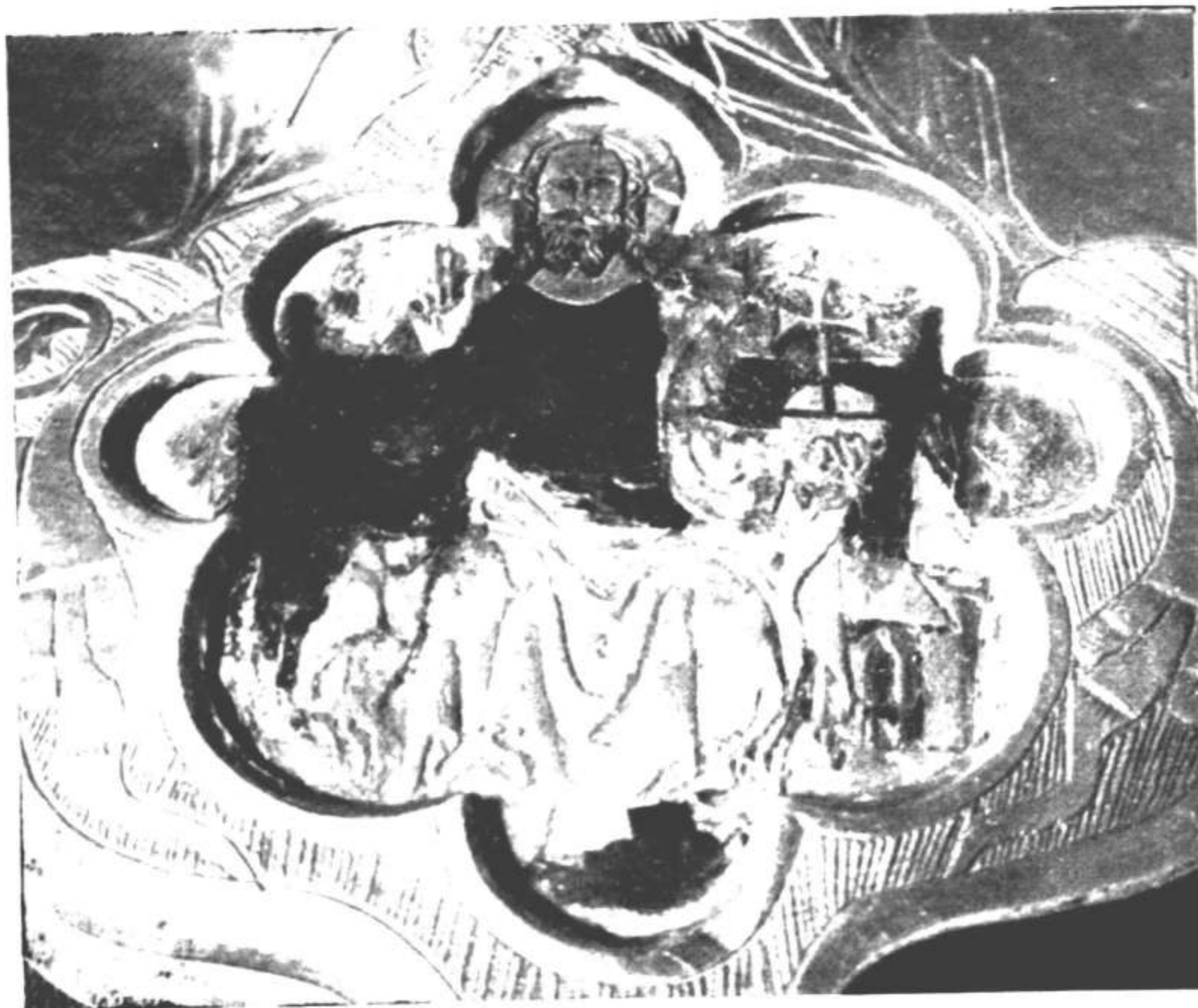
Esmalte que va en el cáliz de Ujué

Asiento de la cuenta que se refiere al cáliz de Ujué.—No se conserva el estuche de que habla esta partida.