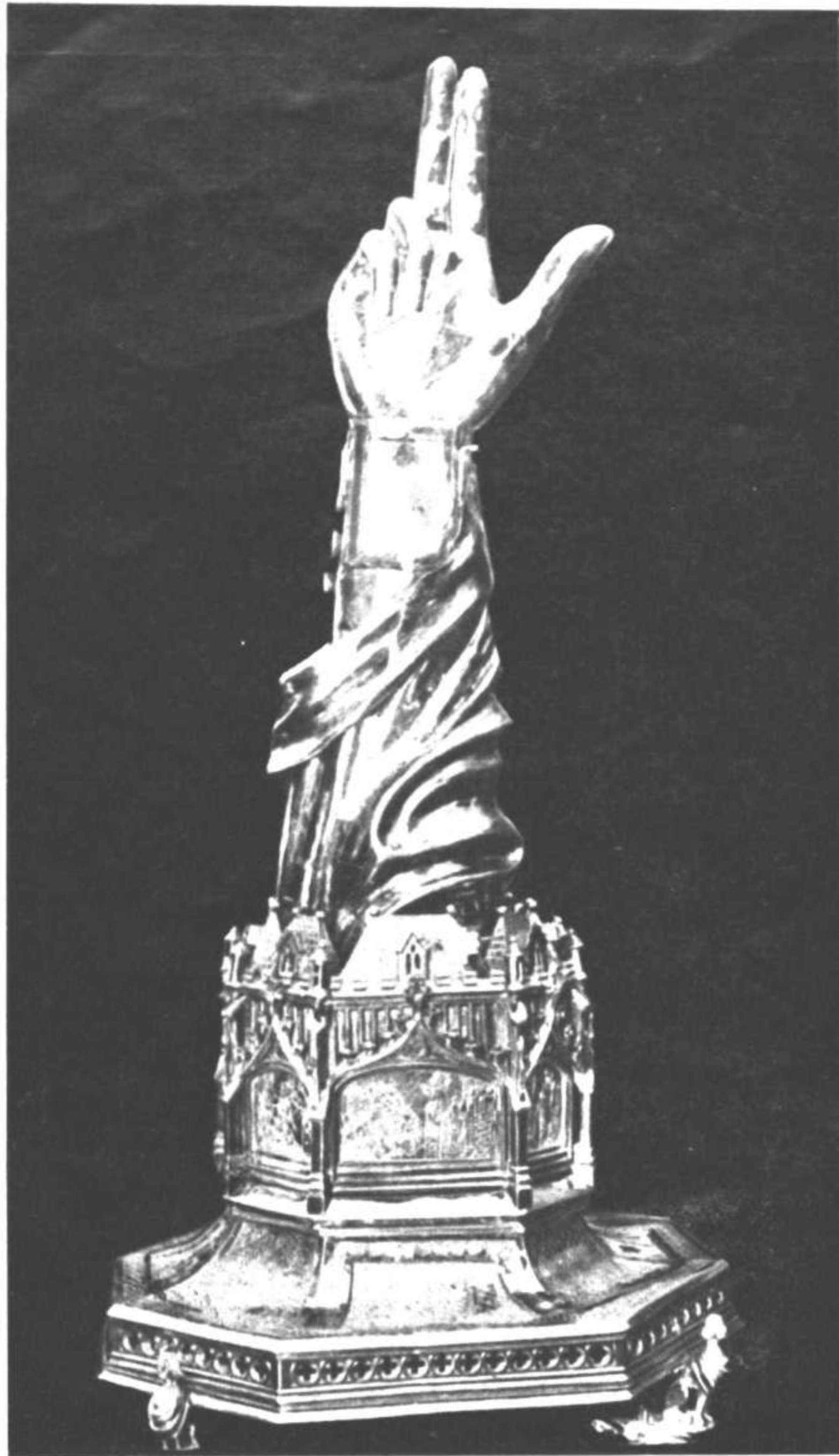
1382—Relicario que contiene el dedo pulgar de San Saturnino, en la iglesia del mismo nombre. Obra anónima