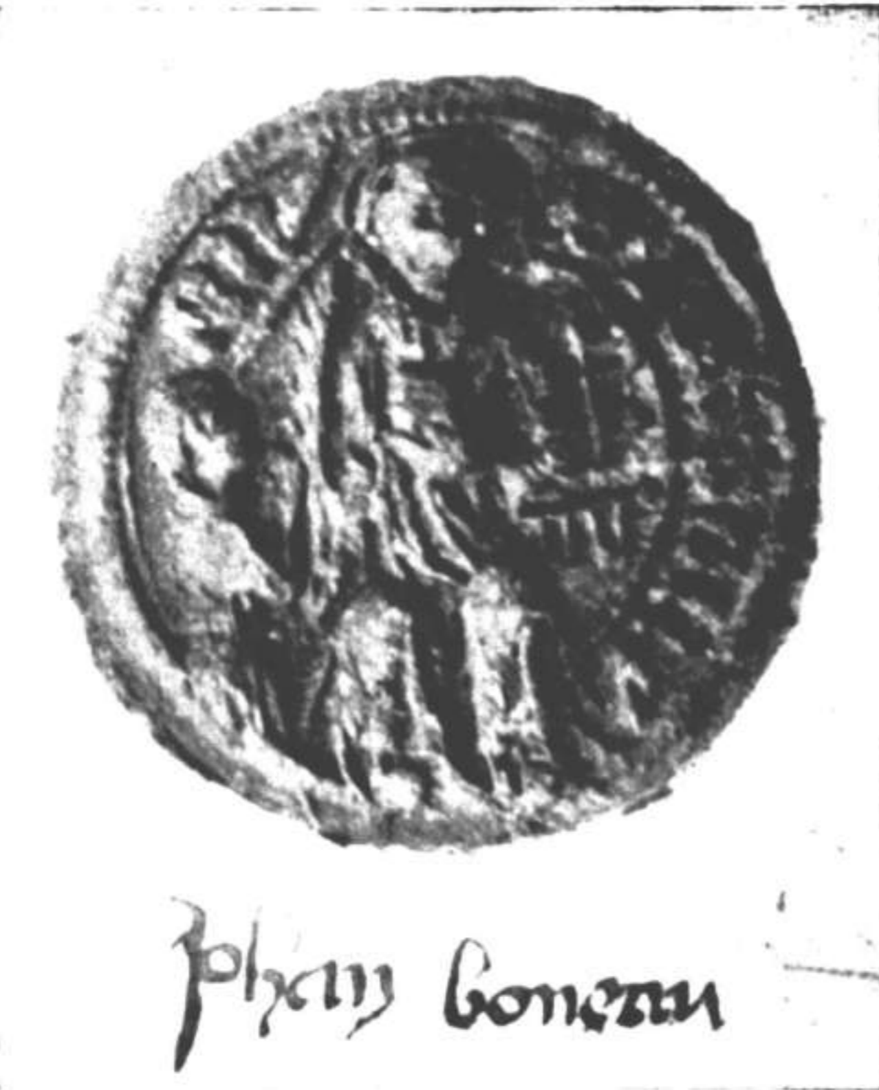
Sello y firma del argentero Garvain el jóven.