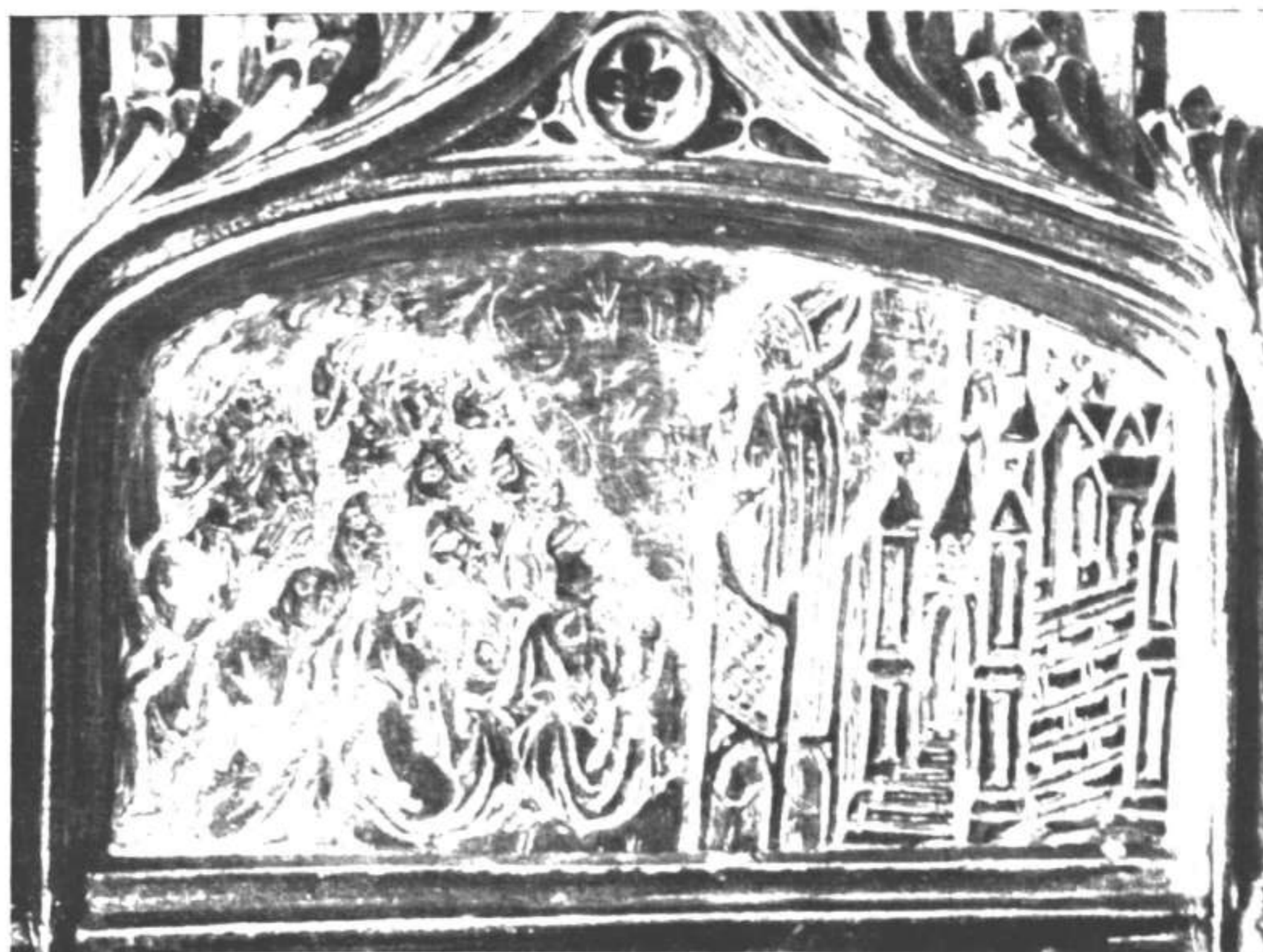
Detalle del relicario de San Saturnino. Predicación del Santo. Labor rehundida.