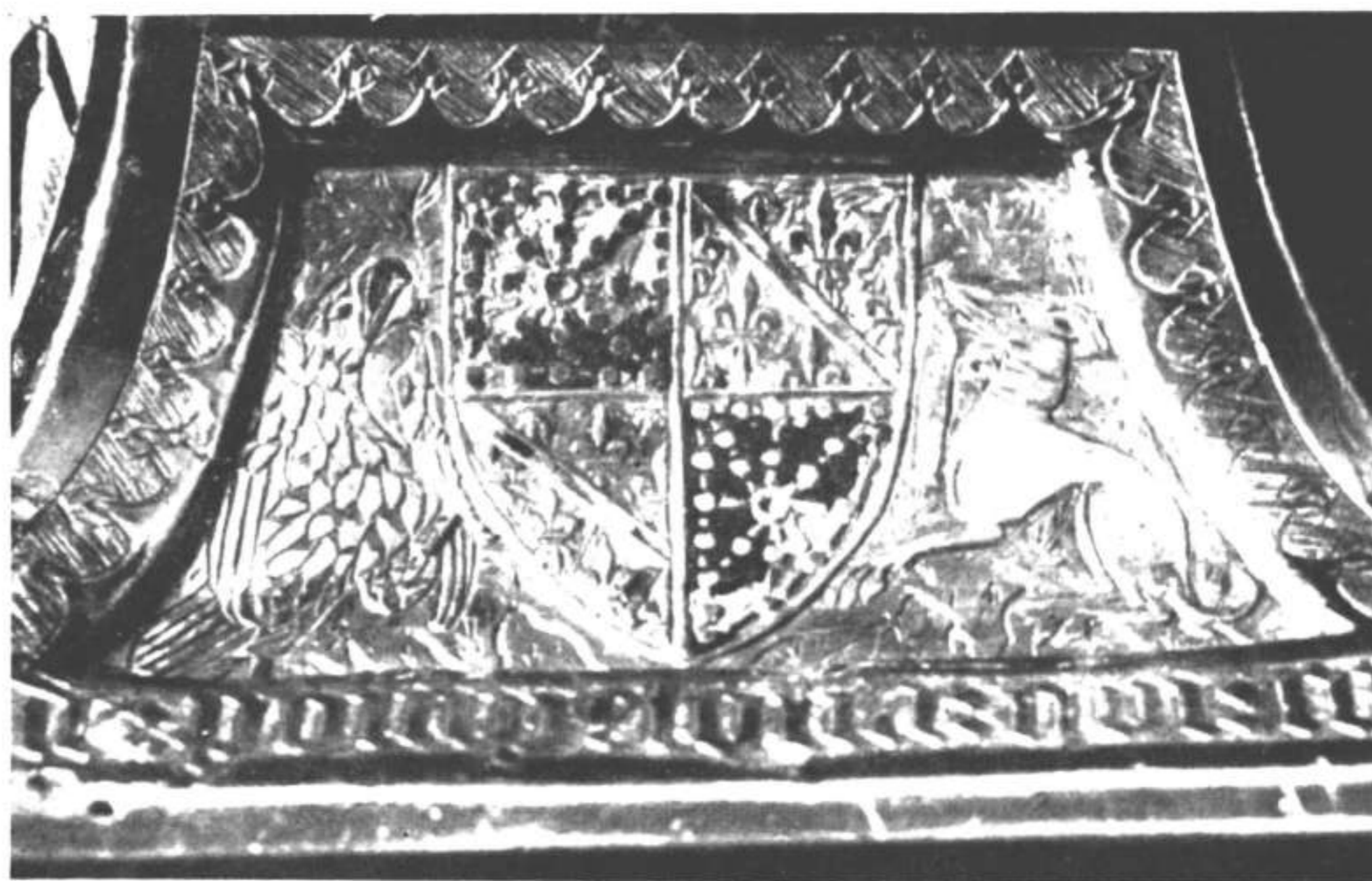
Detalle del relicario de San Saturnino. Las armas de Navarra y de Evreux no indican donación real.—Lebrel. Hojas y fruto de castaño estilizado.