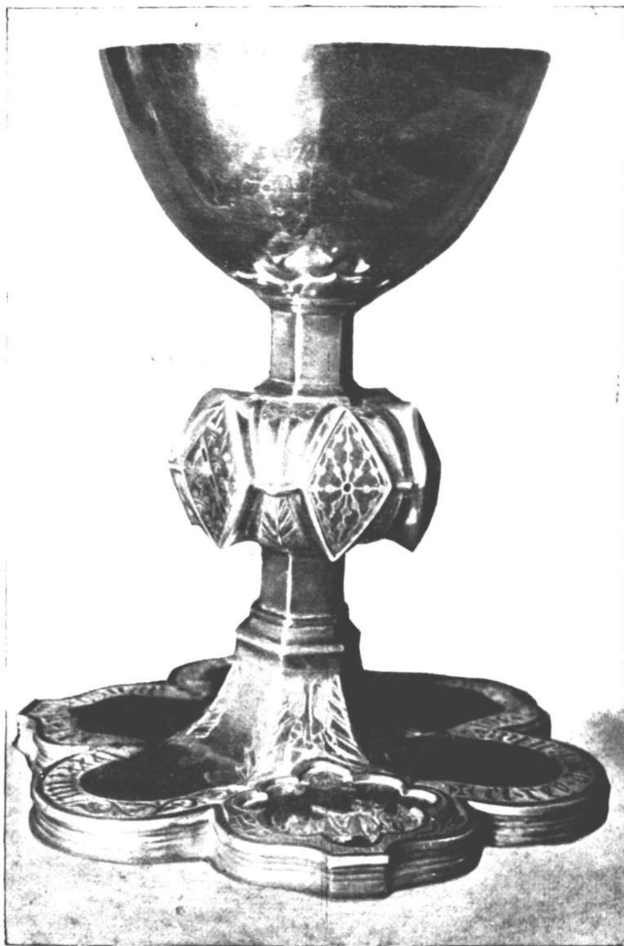
Cáliz, obra de Ferando de Sepúlveda, regalado por Don Carlos a la Virgen de Ujué, que hoy se guarda en el Archivo de Navarra. Los escudos esmaltados de Navarra y de Evreux se repiten en el nudo excesivamente voluminoso.