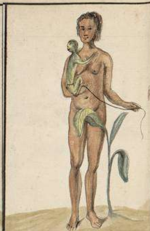
Indio toda desnuda de los Omaguas, que vive en el Rio Napo colateral del Marañon, e Amasonas: tiene su arte en saber pintar: Van los hombres de vistosos plumajes: Su idioma es de una guturacion estruenda: a algunas Republicas e Naciones de esta Tribu les ha instruido a la lo y prudencia del cavallero Comandante de Marañon Sr. D. Joaquin de Sotomayor de Luas braba, con lo que se dilatan en sus Navegaciones y ha sido oido de algunas Tribus.