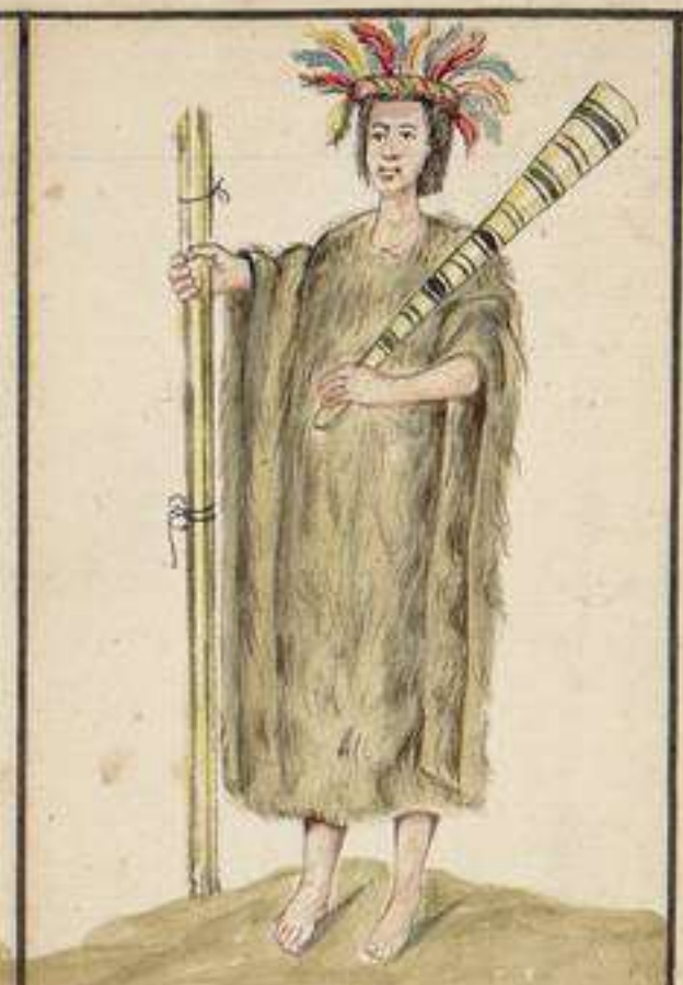
Indio Sipivis, habita las Liberas del Wayali. Se encuentran en esta Nacion muchos blancos y Mujeres hermosas, segun el Padre Giral: Se infiere que sean prisioneros Carapachos: Estos sipivis son heridos por Nigromantios, o agoreros entre aquellas Naciones: los respetan estas: adornanse con vistosos y hermosos Plumajes, haciendo estibar en esto, y en la Masana armoniosa mente pintada su luz: las mujeres de medio cuerpo arriba andan desnudas.