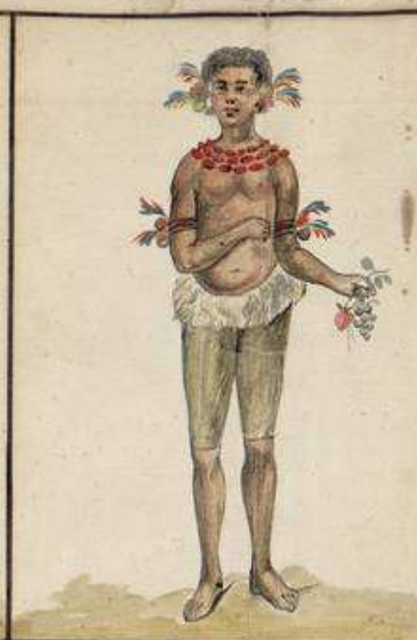
Indio Camachiro que vive cerca de la Boca del mismo Rio Napo: usa del presente traje: Esta Tribu es muy diestra en el uso de la Cerbatana y Vecha, e inclinada a la pesca de que principalmente subsiste; habitan como otras muchas Naciones diferentes Familias en una sola Casa que suele ser de dos o tres con sus divisiones, suele ser una especie de Telas que no tienen Ventanas para luz, que se le entra por el hueco de la puerta.