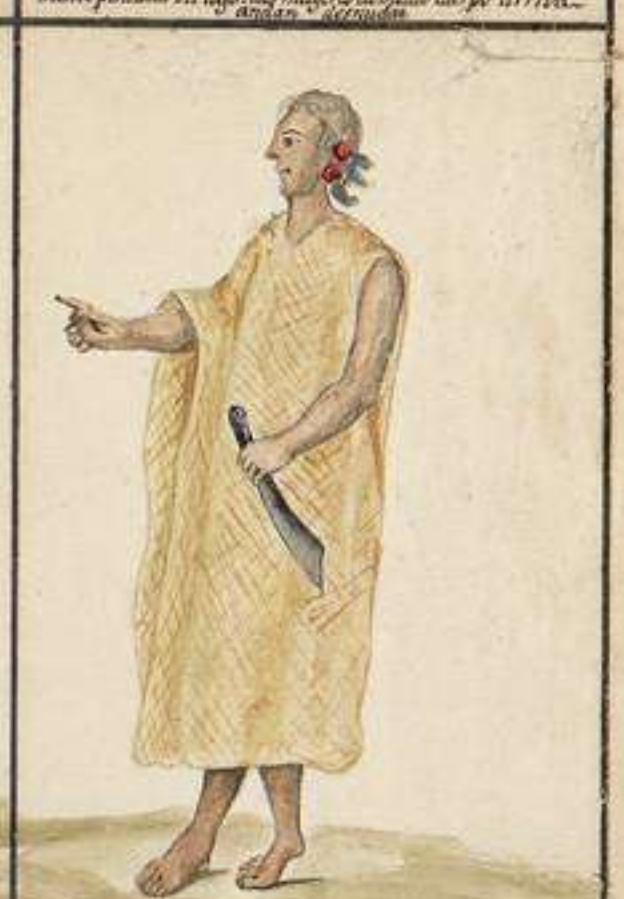
Capanaquas: Viven en las Liberas del Rio estacion colateral del Marañon: Tesis asan y comen a sus difuntos pensando hacerlos obedir, sepultandolos en su vientre: Son diferentes Tribus bajo del mismo nombre: Sus casas son muy grandes, ocupando dos quadras de largo y una de ancho y como se dijo de los Chimichis, viven muchas familias dentro de cada una, aunque con separacion.