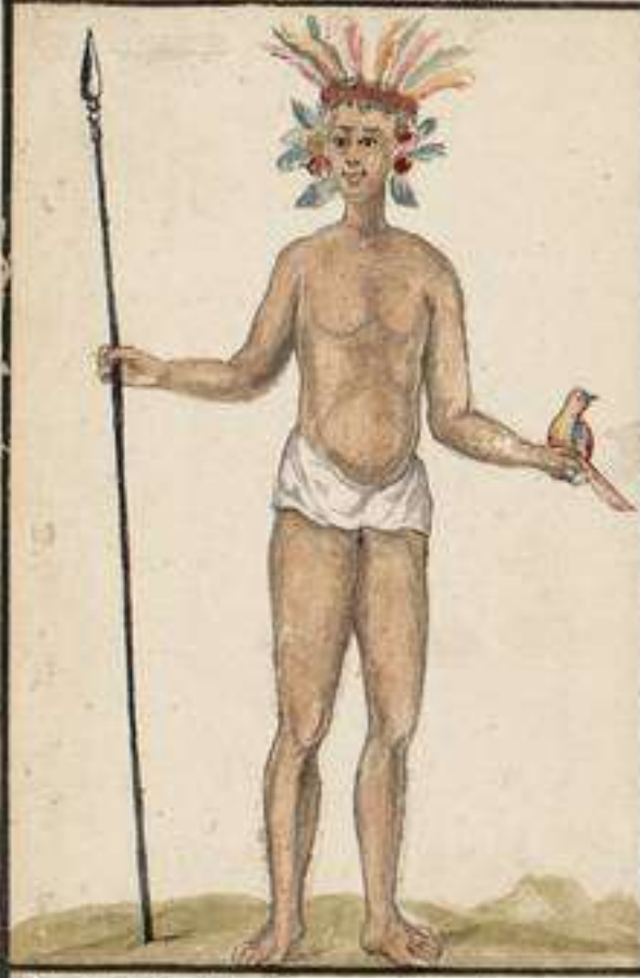
Indio Turi del Rio Titumayo: todo su luxo estriba en el adorno de su cabeza, y es muy solcito en Cazar las Aves que visten las mas brillantes y armoniosas Plumajes: Son muy diestros en la composicion de los Venenos: Su fortaleza y actividad la pruevan en el Caza del Sol, e Zontipichu el mas duro de los Venenos: Es evacion muy guerrera aunque corta por angustiada por sus enemigos por la guerra, y uso de la Solgania.