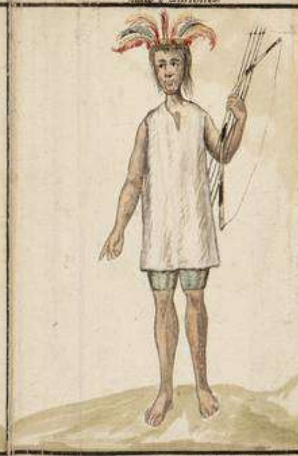
Evacion de los Caribes en las Liberas del Rio Sachitua, que recibe las aguas del famoso Marañon: Son entre los Caribes enemigos de todas las Naciones de la Campaña del Sacramento: No tienen mas ejercicio ni mas gloria que la de matar gente de que se alimentan, igualmente que de Lengudo: El pelo delas que asesinan lo llevan siempre colgando de las flechas en señal de triunfo: Tienen poblaciones fijas donde anidan.