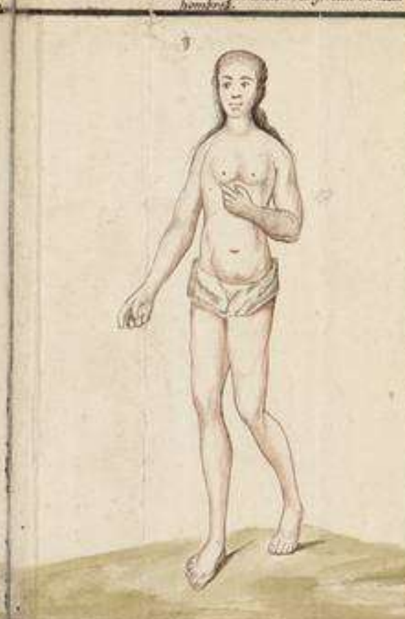
Carapachos, antropofagos que habitan el Rio Sachitua con mas blancos que los Sipivis y poblados de barbas las mujeres y venen andan desnudos con solo su Campanilla: Son de ermosissimo facinme y se rapan media cabeza: despues de haber hecho pacto con el Gijbor al Pecos de su concurrencia le mataron a tra con un hombre, hiriendo a otros. Lavaravilla de color blanco y las distingue de todas las demas Naciones que se tienen de cobre, es punto reservado a profundos conocimientos.