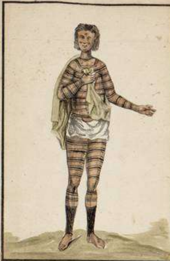
Indias pintadas que habitan las Riberas del Rio Napo colateral del de las Amasonas. Viven de Campanilla y Manta al Ombro: es de inferior y a este caudaloso Rio el mayor que conoce el mundo le hubiesen dado este nombre los primeros Espanoles de la Compuista. al ver estas Mujeres solas y gloriosas a guisa de las hembras de las ocañas del ano de las Indias para a la Casa: de puntalana que se le inicia a aquellos y nuevos entences con los de Malla.