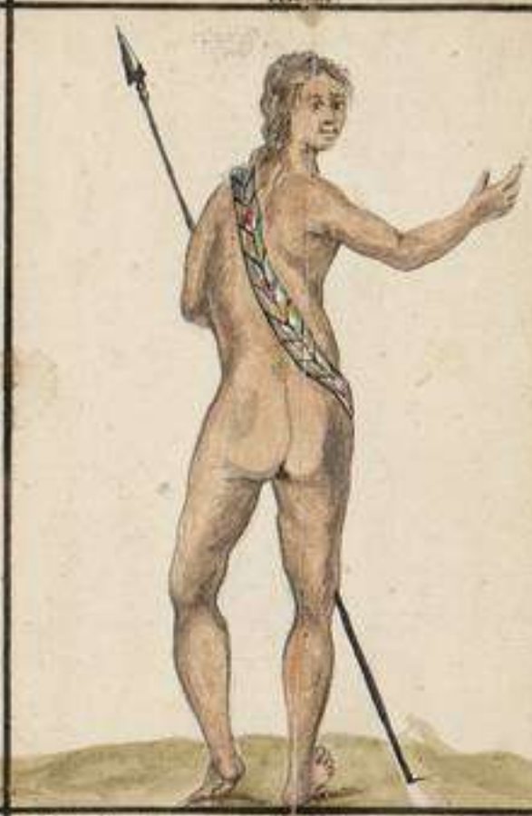
Indio Quito totalmente desnudo menos la Vecha, e Lanza de ermosissimo plumage: habita las Liberas del Rio Napo: Su arma comun es la lanza: Son muy adictos a la Chicha especie de Cerbeza, la fermentan con los cogollos del Arbol Diabla huasca, que los embriaga, y llena de ideas festivas su cerebro como el Opio a los Asiaticos: Tienen sus Oraculos en grande veneracion.