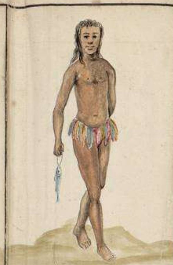
Indio Mago que habita las cercanias del Rio Pecos: andan los de esta Tribu desnudos con solo el Plumage en las partes vergonzosas por adorno, no conociendo las Leyes del pudor son muy dados a la Casa, al paso que diestros en la flecha duermen en Telas y carecen de poblacion: observan como otras Naciones de la vida comun, y si quando la mujer se ausenta duermen con los hijos y Parientes varones que la siguen, el marido que se queda en casa hace lo proprio con las hijas y Parientes.