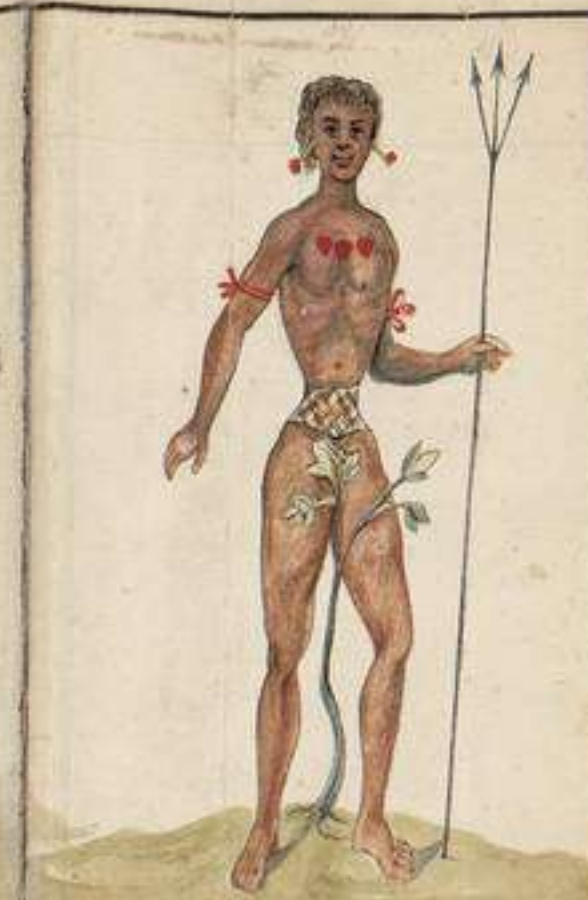
Indio Guagua o Maguari, habita las Liberas del Napo: es en antropofago y cuelgan al pecho los conchones de los que mueren en la Campaña: Soltan la carne humana para comersela y alimentarse: Son errantes, pero en ciertas estaciones buelven a su patria nido, segun el Padre Giral que ha dado es las Noticias: Son los hombres mas ligeros que conoce el mundo, y han de contribuir lo cenido de su cultura tan de grado quanto no se creeble: Es muy temida esta Nacion por cruel en el ejercicio de Cazar hombres.