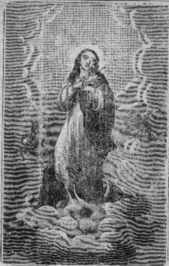
AMA BIRGIÑAREN SORTZE CHIT GARBIA