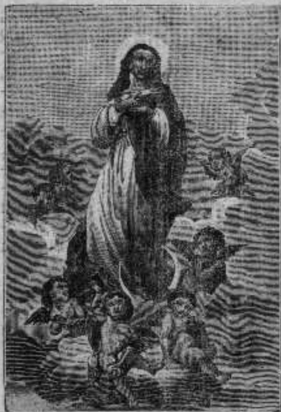
AMA BIRGIÑAREN SORTZE CHIT GARBIA