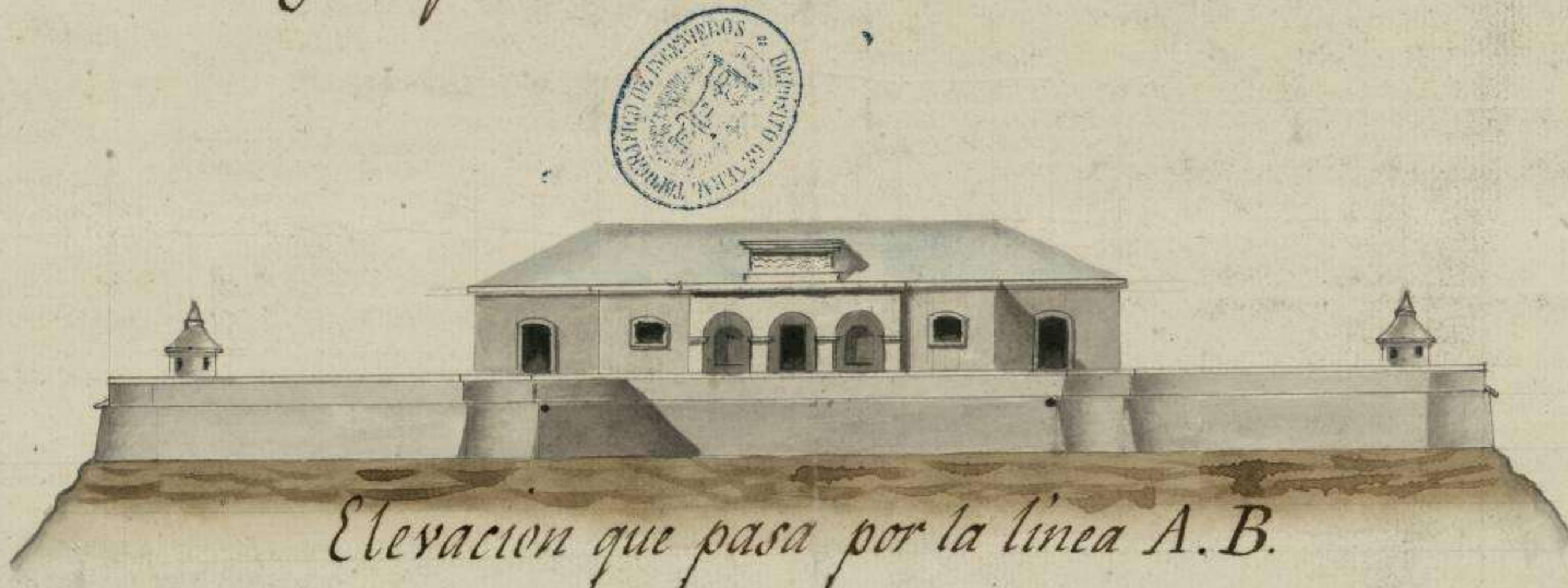
Elevacion que pasa por la linea A. B.