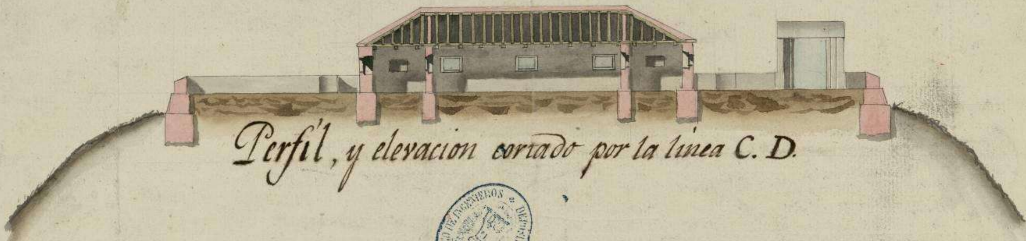
Perfil, y elevacion cortado por la linea C. D.