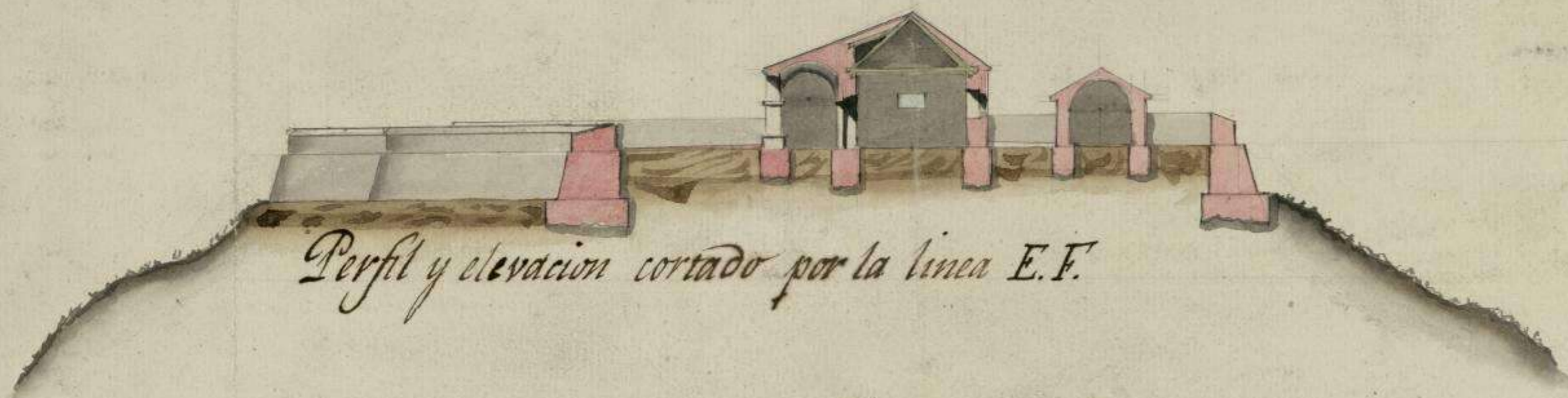
Perfil y elevacion cortado por la linea E.F.