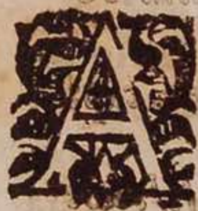
Tabla de lo contenido en las Diffiniciones.

A Bsoluer con plenaria indulgencia pueden los confesores a las personas de esta orden en el articulo de la muerte. cap. 79. fol. 80.