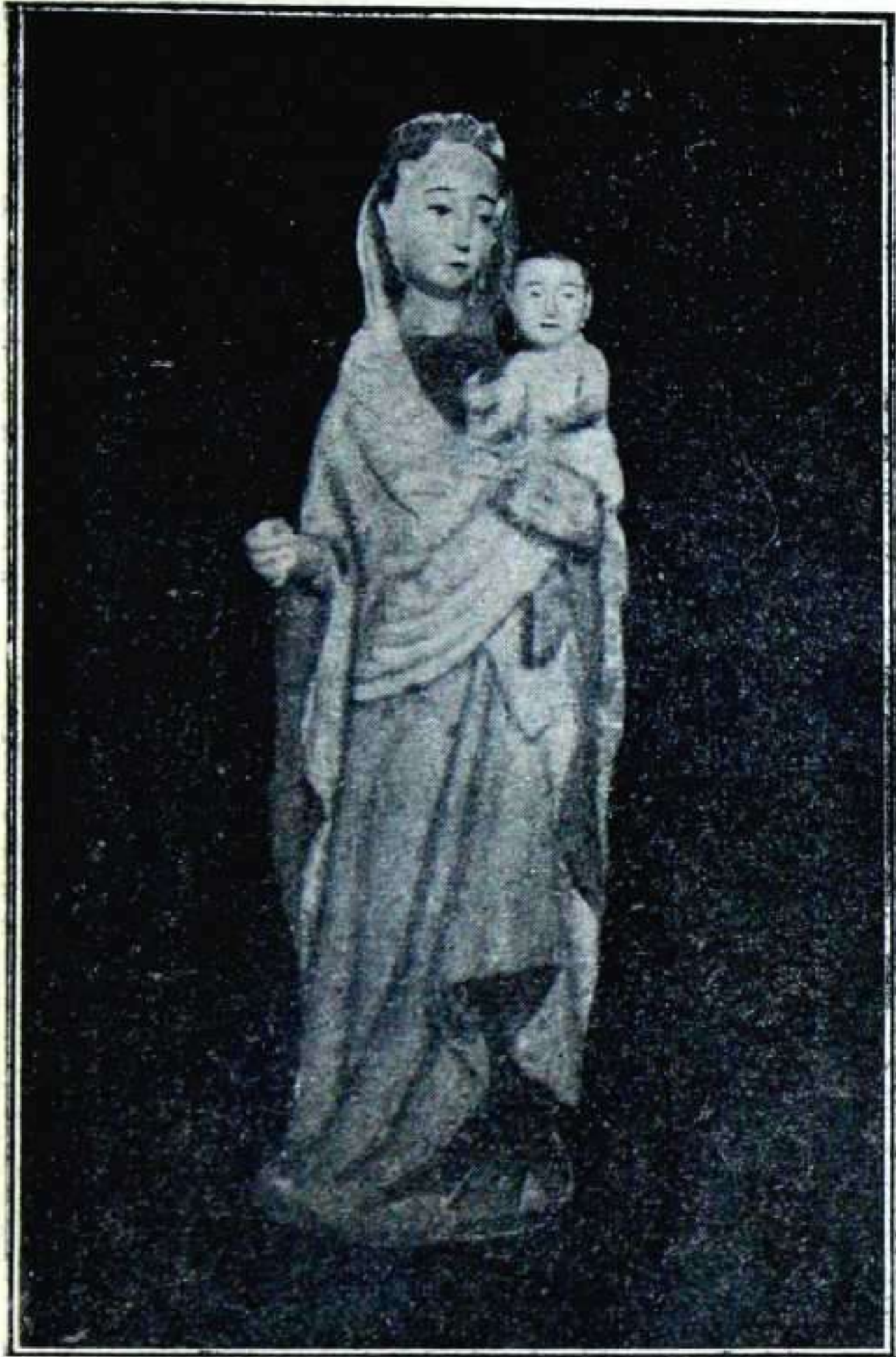
Arrietokietako Andra Mariaren irudia