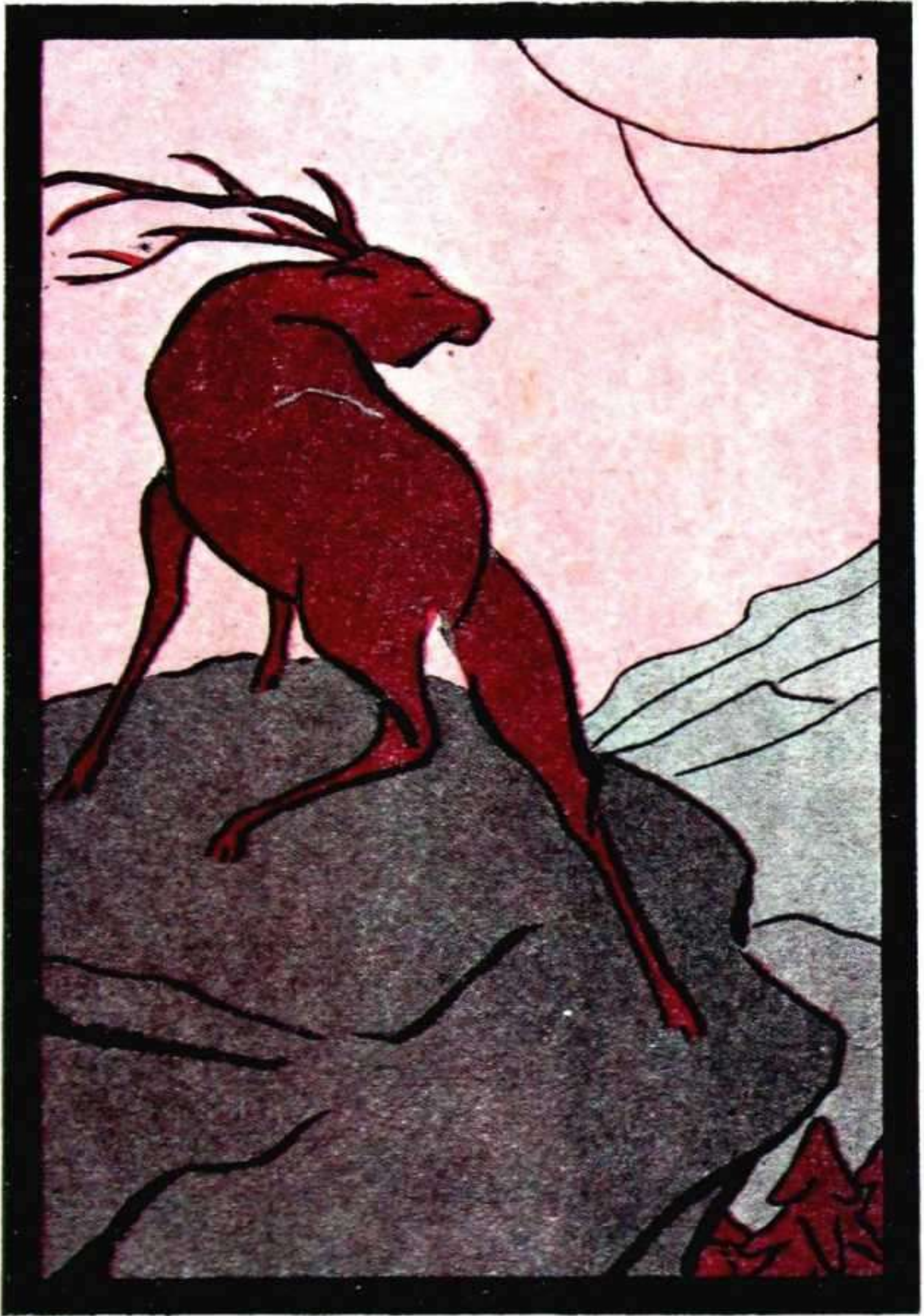
Ari - Gurutz