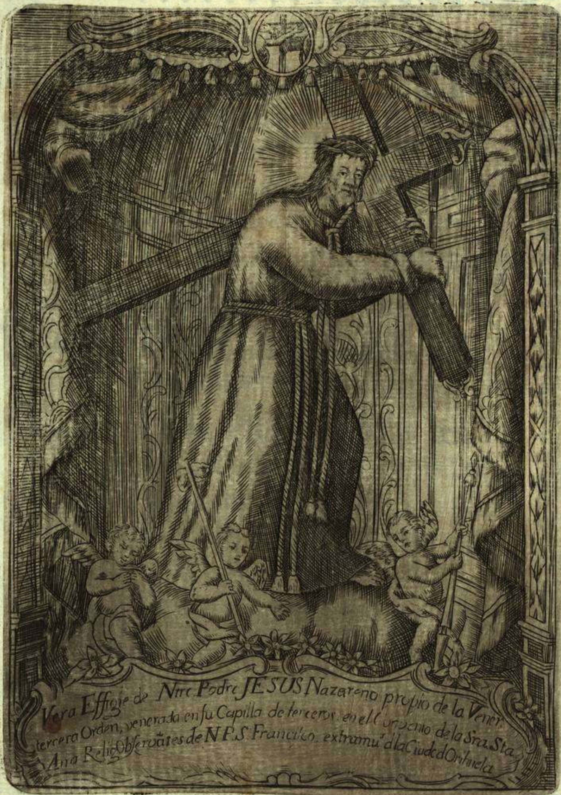
Vera Effigie de Nro Padre JESUS Nazareno propio de la Vener. tercera Orden, venerada en su Capilla de terceros, en el Oratorio de la Sra. Sta. Ana Relig. Observantes de N.P.S. Franciscan. extramur. d la Ciudad Orinducla