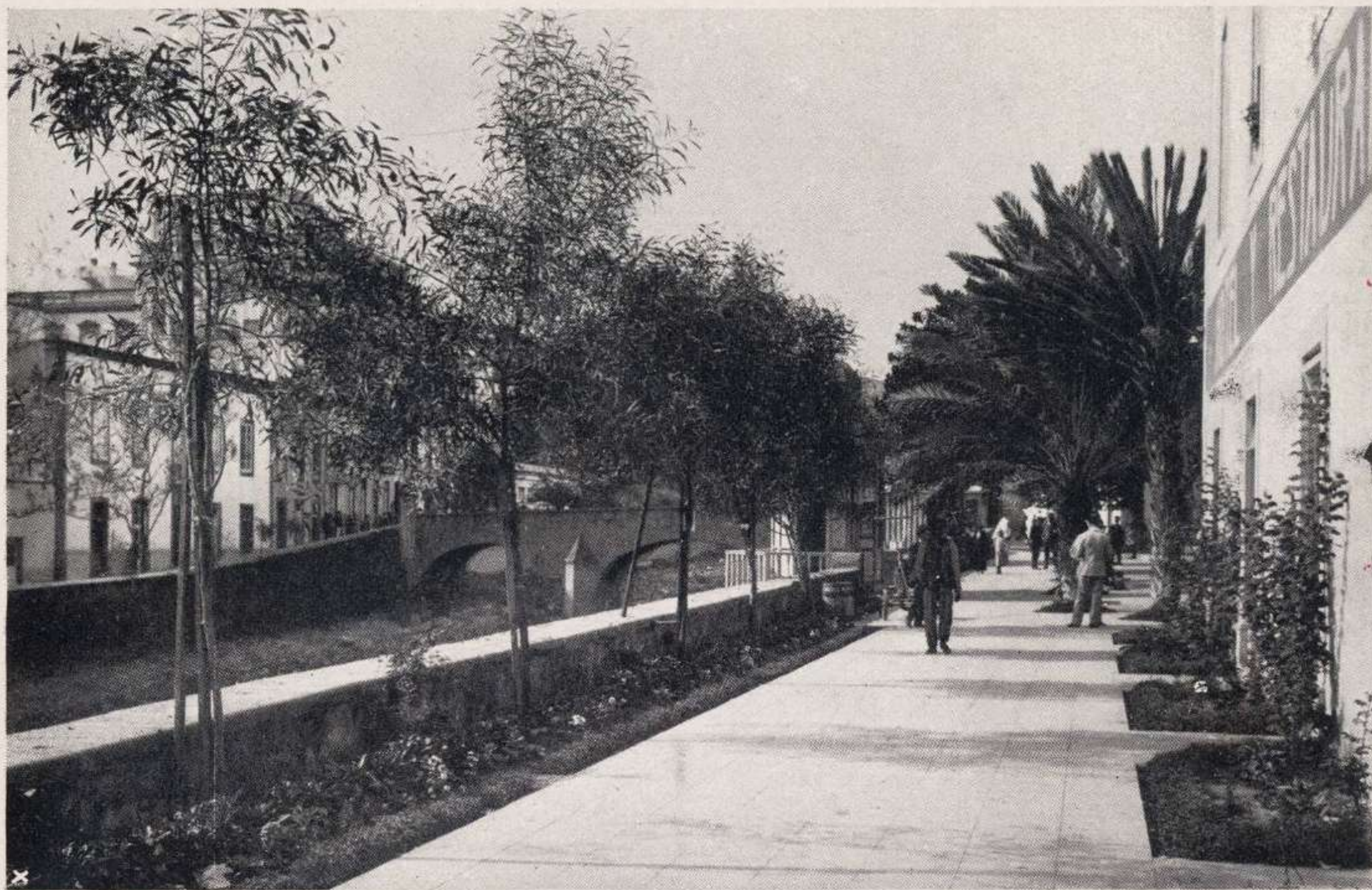
Divide la Ciudad, pasando entre los barrios de Vegueta y de Triana, que se comunican mediante los puentes del Verdugo y de López Botas.