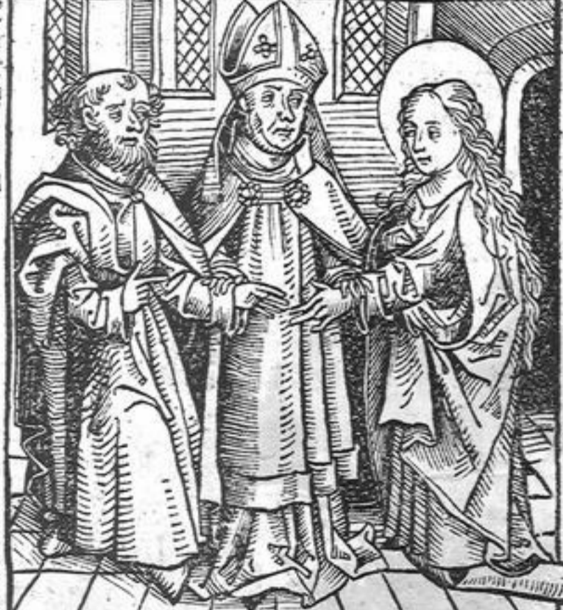
Despolatio vgr marie.