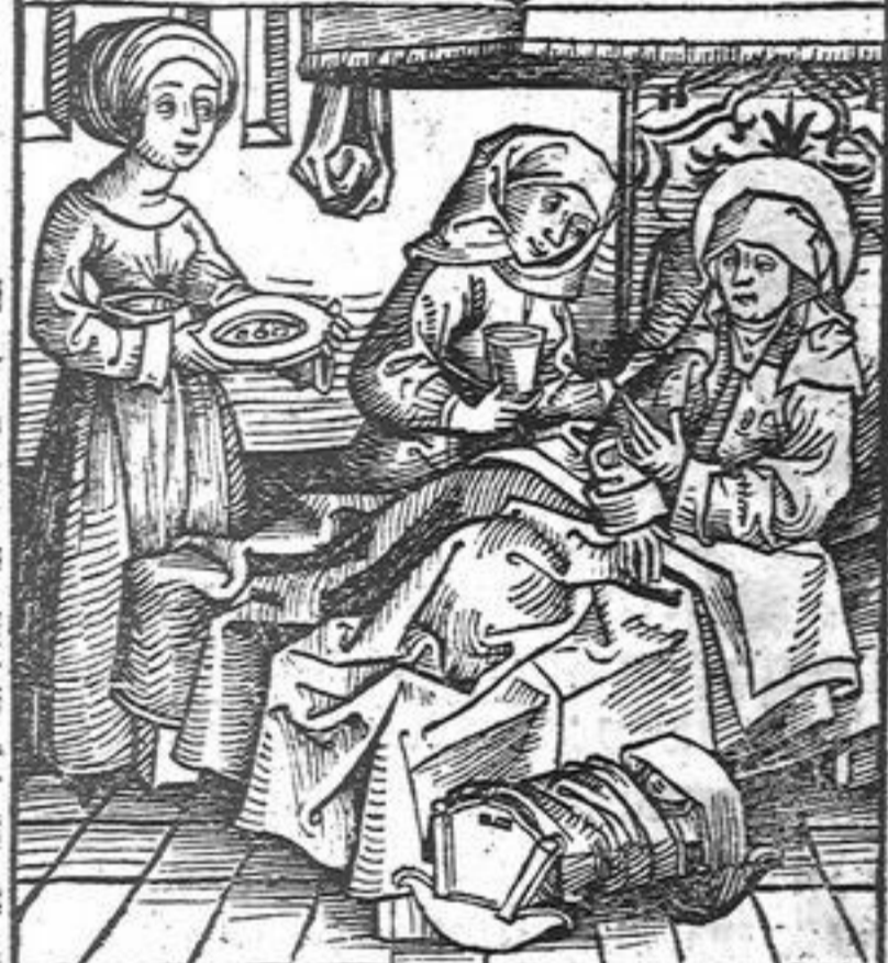
Antea bte vgr marie

I ohannes baptista xpi ibi precursor ex sanctissimis parentibus Zacharia et Elizabeth natus. vir ab ipso matris sue utero sanctificatus. et inter mulierum natos (domino testante) non surrexit maior isto: quippe propheta et plus quam propheta fuit cum christi redemptorem digito monstravit dicens. Ecce agnus dei et cetera. Post transactis infantie annis lxx tenellus et parentibus antiquis unicus ob amore celestis patrie heremum petiit. Post hec cum trigessimam vite sue annum attigisset duodecimo imperij Tiberij cesaris anno procuratore pontio pilato iudea factum est verbum domini super eum in deserto. Et venit in omnem iordanis regionem: predicans baptismum penitentiae. eam ob rem multis ad eum concurreribus singulis qui buscumque interrogantibus: convenientia dabat responsa. Demum ab herode antipa paulo ante predicationem christi captus carceri mancipatus. Arguebat enim ipse dicens. Non licet tibi habere uxorem fratris tui. Et illa instigata per annos pedore carceris et maxima inedia eum macerari fecit: post annum adveniente die natalis herodis convocavit cunctos gallilee principes et nobiliores ad convivium: quibus epulantis herodiadis filia vocibus gestavit ac saltavit: et summe placuit regi: quod iuramento pollicitus est dare quocumque postulasset: a matre promonita: petiit caput Iohannis in disco. Rex contristatus propter iusiurandum missis spiculatoribus decolari eum fecit.